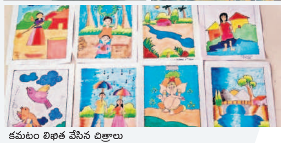
కమలం లిఖిత వేసిన చిత్రాలు