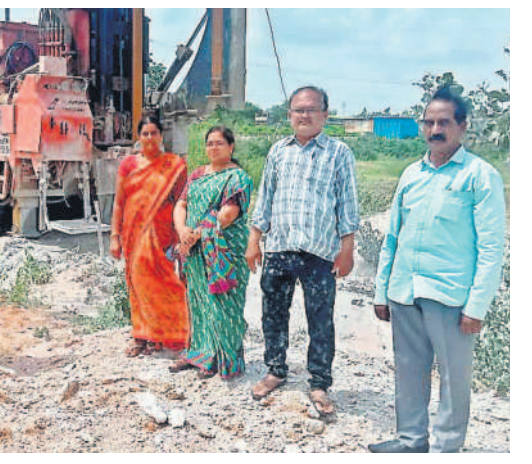
బోరును పరిశీలిస్తున్న అధికారులు

ఈ పథకం కింద గిరిజన రైతులను గుర్తించి, వారి భూముల్లో జియాలజిస్ట్ సర్వే చేస్తారు. ఆయన సిఫార్సు చేసిన చోట బోరు బావి తవ్వింది, విద్యుత్ సదుపాయం కల్పించి మోటరు పంపును ఏర్పాటు చేస్తారు. ఆవసరమైన చోట భూమి అభివృద్ధి పనులు, సహజ వనరుల యాజమాన్యం పనులు చేపడుతారు. ఈ పథకానికి గిరిజనులే అర్హులు. ఇద్దరు లేదా అంత కంటే ఎక్కువ వ్యక్తులను కలిపి ఒక బ్లాక్ గుర్తిస్తారు. ఒకే కుటుంబానికి చెందిన వారై ఉండకూడదు. ఒక బ్లాక్లో ఐదెకరాలకు మించి భూమి ఉండాలి. ఒక బ్లాక్ కు చెందిన భూమి కంటే నూర్వూగా ఉండాలి. షెడ్యూల్డ్ తెగల వారికి సంబంధించిన అప్లైడ్, పట్టణ భూములు కూడా పరిగణలోకి తీసుకుంటారు.