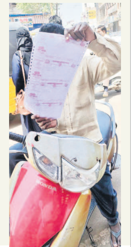
చెల్లించిన చలాన్లను చూపుతున్న వాహనదారుడు

నిజామాబాద్ కమిషనరేట్ పరిధిలో ప్రతి వాహనదారుడు ఆర్టీపి, ట్రాఫిక్ నిబంధనలు తప్పనిసరిగా పాటించాలని సంబంధిత శాఖల అధ్యక్షులలో అవగాహన సదస్సులు నిర్వహించినా ఎలాంటి ప్రయోజనం లేకుండా పోతుంది. కమిషనరేట్ పరిధిలోని నిజామాబాద్, ఆర్కూర్, బోధన్ డివిజన్ లోని పోలీస్ స్టేషన్ల అధ్యక్షులలో అవగాహన సదస్సులు నిర్వహిస్తూ వస్తున్నారు. ట్రాఫిక్, సివిల్ పోలీసులు సైతం వాహనాల తనిఖీ చేపడుతూ జరిమానా విధిస్తున్నారు. జిల్లా కేంద్రంలోని ప్రధాన కూడళ్లు, రద్దీ ప్రదేశాల్లో సీట్ బెల్ట్ పెట్టుకొని ఛార్జీ వీల్ డ్రైవర్లతోపాటు హెల్మెట్ లేకుండా ద్విచక్ర వాహనం నడుపుతున్న వారికి, ట్రీపుల్ రైడింగ్, రాంగ్ రూల్స్, ట్రూపులను తేసి, ఆర్టీపి నిబంధనలు పాటించని వారికి ఈ చలాన్ విధిస్తున్నారు. ట్రాఫిక్ పోలీసులే రోజూ ఉదయం నుంచి రాత్రి వరకు వందలాదిగా ఈ చలాన్లు విధిస్తున్నారంటే వాహనదారులు ట్రాఫిక్ నిబంధనలను ఎంత మేరకు ఉల్లంఘిస్తున్నారో తెలుస్తున్నది.