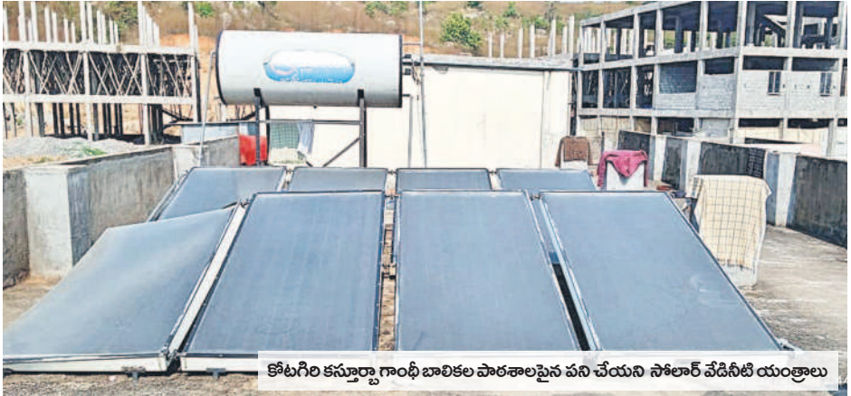
కోటగిరి కస్తూర్బా గాంధీ బాలికల పాఠశాలపైన పని చేయని సోలార్ వేడినీటి యంత్రాలు

లేకుండా చర్యలు తీసుకోవాల్సిన సంబంధిత ఉన్నతాధికారులు పట్టణంలో వేదని వారు వాపోతున్నారు. పనిచేయని సోలార్ వేడి నీటి యంత్రాలు కోటగిరి మండల కేంద్రంలోని కస్తూర్బా గాంధీ బాలికల పాఠశాలలో సోలార్ వేడినీటి యంత్రాలు ఏర్పాటు చేశారు. అవి మరమ్మత్తులకు గురయ్యాయి. వాస్తవానికి రాష్ట్రంలో గత సంవత్సరం నుంచి అన్ని వసతి గృహాల్లో విద్యార్థుల స్నానానికి వేడి నీటిని అందించాలనే సూచనలు ఉన్నప్పటికీ ఇక్కడ మాత్రం యంత్రాలు పనిచేయడం లేదనే సెలంతో సంబంధిత శాఖ అధికారులు పట్టణంలో వేదని విద్యార్థినుల తల్లిదండ్రులు వాపోతున్నారు. తప్పనిసరి పరిస్థితుల్లో విద్యార్థినులు చన్నీటి స్నానాలు చేసి అనారోగ్యానికి గురవుతున్నారు.