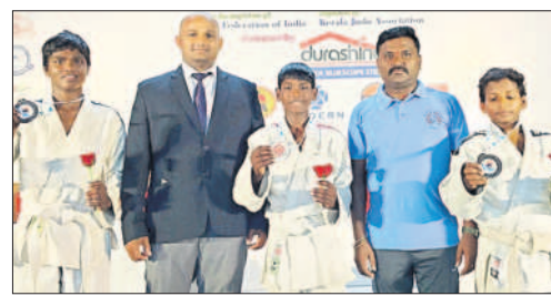
పతకాలు సాధించిన రాష్ట్ర జట్టు క్రీడాకారులు