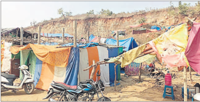
నర్సింకాపూర్ శివారులో గుట్టబోరుకు ప్రజలు వేసుకొన్న షెడ్లు

జగిత్యాల, డిసెంబర్ 17 (నమస్తే తెలంగాణ): జగిత్యాల రూరల్ మండలం నర్సింకాపూర్ శివారు పరిధిలో 437/112/2 సర్వే నంబర్ లో దాదాపు 220 ఎకరాల ప్రభుత్వ భూమి ఉంది. అయితే, ఈ సర్వే నంబర్ తో పాటు మరికొన్ని సర్వే నంబర్లలో సైతం ప్రభుత్వ భూములు ఉన్నాయి. ఇవన్నీ గుట్ట బోర్లై. అయితే, కొద్ది నెలల క్రితం గుట్ట బోర్లను చదును చేసి, వాటిని ప్రభుత్వ కార్యకలాపాలతో పాటు, కొన్ని కార్యాలయాలకు ఇవ్వాలన్న ఆలోచనను ప్రభుత్వం చేసింది. ఈ క్రమంలో గుట్టబోర్లను చదును చేసే కార్యక్రమం ప్రారంభమైంది. విషయం తెలుసుకున్న వెంటనే సీపీఐ(ఎం) పార్టీ ఆధ్వర్యంలో ఇండ్ల పట్టాలు ఇప్పిస్తామని, ప్రజలు కలిసివచ్చి తమ తో పాటు ఉద్యమిస్తే ఇది సాధ్యమవుతుందని ప్రకటించారు. అధికారులు, ప్రజా ప్రతినిధులతో ప్రాతినిధ్యం వహించి పేదలకు ఇండ్ల స్థలాన్ని ఇప్పించేలా చూస్తామని, అవసరమైతే పోరాటం చేస్తామన్నారు.