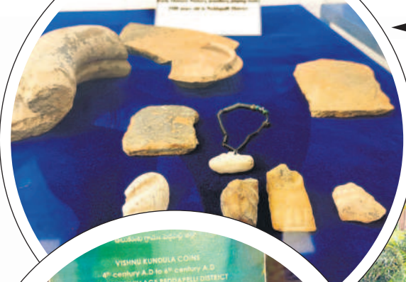
2544 సంవత్సరాల క్రితం తొలి చారిత్రాత్మక యుగం నాటి మట్టి పాత్రలు, ఆట వస్తువులు, ఆభరణాలు