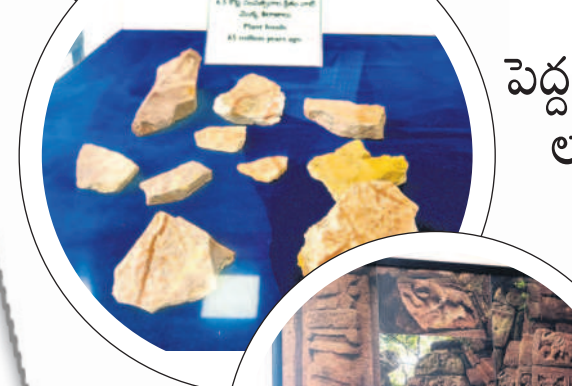
కోట్ల సంవత్సరాల క్రితం నాటి మొక్క శిలాజాలు