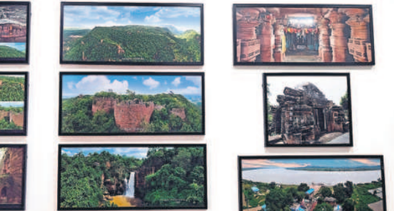
జిల్లాలోని చారిత్రాత్మక ప్రదేశాల ఫాటోలు