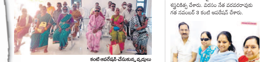
పేదల కండ్లలో కాంతులు నింపడమే లక్ష్యం

ఉమ్మడి జిల్లా వ్యాప్తంగా సేవలు జీసీఎం దవాఖాన ఆధ్వర్యంలో రాజన్న సిరిసిల్ల జిల్లాతో పాటు, కరీంనగర్, జగిత్యాల జిల్లాలోనూ సేవలందిస్తున్నారు. దవాఖాన వైద్యులతో తమ బృందంతో వెళ్ళి నిత్యం ఏదో ఒక గ్రామంలో వైద్య శిబిరాలు నిర్వహిస్తున్నారు. ఇప్పటివరకు 93 గ్రామాల్లో ఉచిత కంటి వైద్య శిబిరాలు నిర్వహించి, 9243 మందికి ఉచితంగా కంటి పరీక్షలు చేశారు.