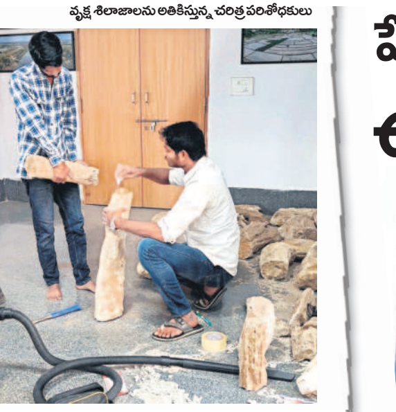
వృక్ష శిలాజాలను అతికిస్తున్న చరిత్ర పరిశోధకులు

అలయాలతోపాటు చారిత్రాత్మక ప్రదేశాల డిజిటల్ ఫాటోలను మ్యూజియంలో ప్రదర్శిస్తున్నారు. రామగిరి ఖిల్లా, దూళిక్కట్ల బొద్దస్తూపం, మంధని మండలం ఖానాపూర్ లోని మొసల్లమడుగు(ఎల్ మడుగు), రామగుండంలోని రామునిగుండాలు, సబ్బితం, పాండవలంక జలపాతాలు, కాల్యుశ్రీరాంపూర్ లోని వేద పాతకాల, సుల్తానాబాద్ మండలంలోని మూడుజాముల కొదురుపాక, బసంతనగర్ లోని బుగ్ గుట్ట, గుంజుడుగులోని కాసిపేట గుట్ట, ఖమ్మంపల్లిలోని సందర్బెల్లి గుట్ట ఇలా ఎన్నో ప్రదేశాల ఫాటోలను ఉంచారు. అలాగే గోదావరి తీర్థి, జిల్లాపరిధిలోని కాళేశ్వరం పరిసరాలను, వ్యాకోడేలు, ఎన్టీపీసీ, ఆర్ఎస్సీఎల్, పాలకుర్తి మండలం అటవీశాఖ పార్క్ ఇలా ఎన్నో చిత్రాలను పొందుపరిచారు.