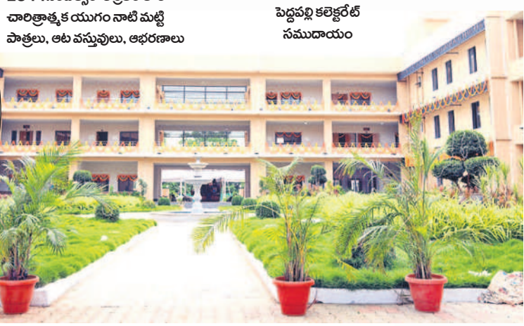
పెద్దపల్లి కలెక్టరేట్ సముదాయం

జిల్లాలో ప్రసిద్ధి గాంచిన అలయాల ఫాటోలను మ్యూజియంలో పొందు పరిచారు. ఓడల మల్లికార్జున స్వామి, మంధనిలోని శ్రీ గౌతమేశ్వర స్వామి, మహాలక్ష్మీ, భీక్షిశ్వరస్వామి, మహాగణపతి, కన్యాల వేంకటేశ్వర స్వామి, ముత్తూరం గుట్టపై ముత్తేశ్వరస్వామి, రంగనాయక స్వాములు దేవాలయం, రాగినేడు శివాలయం, దేవునిపల్లిలో స్వనింహస్వామి ఆలయం, నందిమేడూరులో ఆమరేశ్వర ఆలయం, త్రికూటాలయం, భారీ నంది విగ్రహం, ఖనిలోని జనగామ శివాలయం ఇలా అలయాల ఫాటోలను డిజిటలైజ్ చేసి ఇక్కడ ఉంచారు.