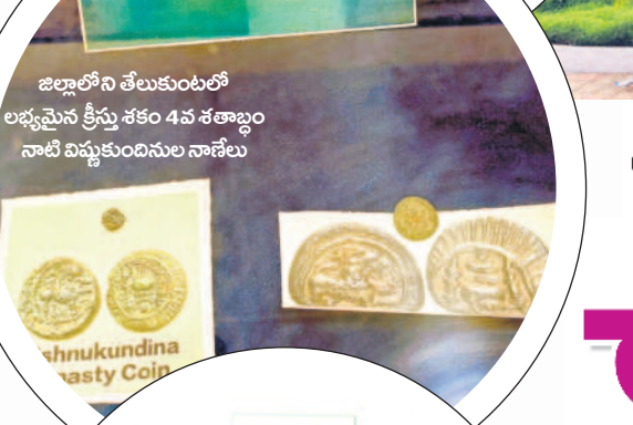
జిల్లాలోని తేలుకుంటలో లభ్యమైన క్రీస్తు శకం 4వ శతాబ్దం నాటి విష్ణుకుండినుల నాణేలు