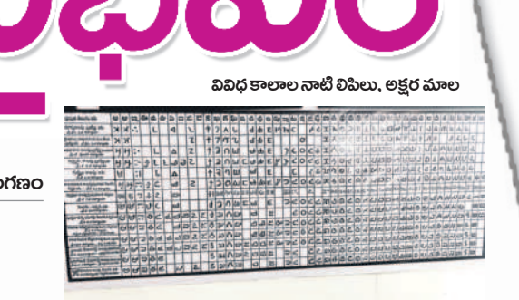
వివిధ కాలాల నాటి బిబిలు, అక్షర మాల