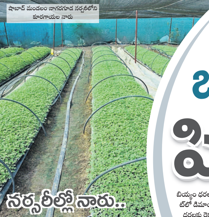
షాబాద్ మండలం నాగరగూడ నర్సరీలోని కూరగాయల నారు