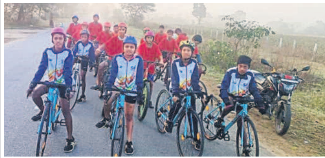
రామాయంపేటలో 2కే రన్ సైక్లింగ్ క్రీడా పోటీ

మెదక్ అర్బన్, డిసెంబర్ 17 : బ్రెయిన్ ట్యూమర్లకు భయపడొద్దని, ఇప్పుడు అత్యాధునిక టెక్నాలజీతో శస్త్ర చికిత్స చేస్తున్నాని యశోద దవాఖాన సీనియర్ న్యూరో సర్జన్ డాక్టర్ కేఎస్ కిరణ్ తెలిపారు.