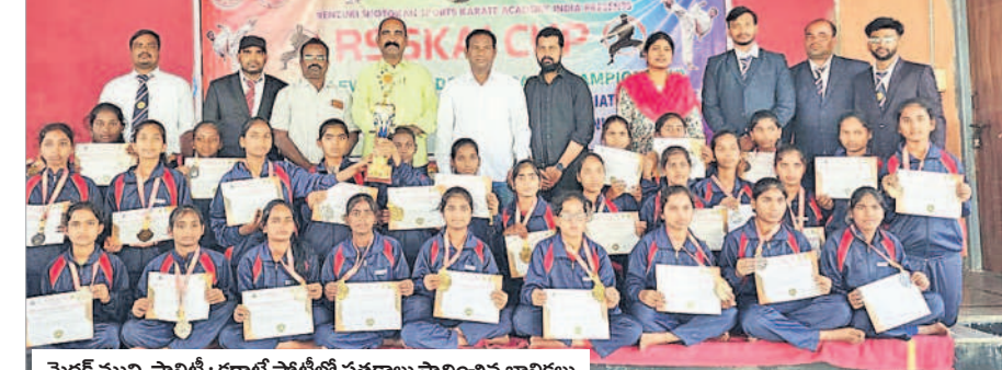
మెదక్ మున్సిపాలిటీ : కరాట్ పోటీల్లో పతకాలు సాధించిన బాలికలు