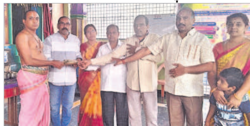
ఆలయ కమిటీ సభ్యులకు నగదు అందజేస్తున్న దంపతులు