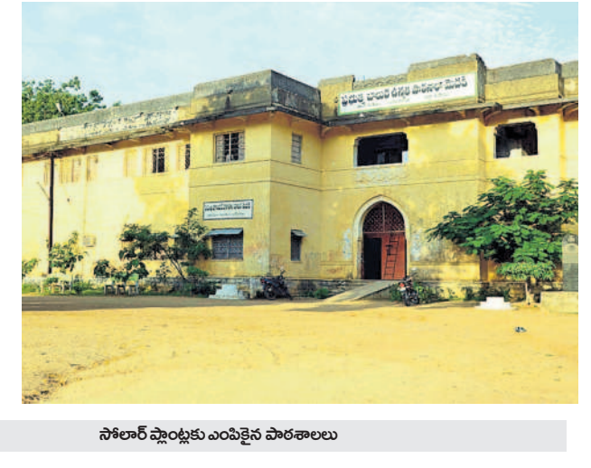
సోలార్ ప్లాంట్లకు ఎంపికైన పాఠశాలలు