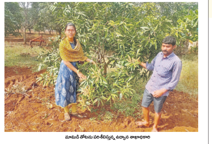
మామిడి తోటను పరిశీలిస్తున్న ఉద్యాన శాఖాధికారి

బూడిద తెగుళ్లు.. : మామిడి తోటలో బూడిద తెగుళ్లు ఆశ్చర్య వెంటనే చర్యలు తీసుకోవాలి. దీని కోసం నీటిలో కలిపి రెండు గ్రాముల గంధకం లేదా ఒక మిల్లీ లీటర్ కెండావెన్ లేదా ఒక గ్రాము మైకోబ్యూటిన్ లేదా ఒక గ్రాము బేరిటాన్ ఒక లీటర్ నీటిలో కలిపి పిచికారి చేయాలి. అవసరం వచ్చినప్పుడు బట్టి పదిహేను రోజుల తర్వాత మార్చి పిచికారి చేయాలి. మన్న తెగుళ్లు.. : మామిడి తోటలో ఎండిపోయిన కొమ్మల్ని వెంటనే తీసివేయాలి. వాటిని లీటర్ నీటికి మూడు గ్రాముల కాపర్ కెండావెన్ లేదా ఒక గ్రాము మైకోబ్యూటిన్ లేదా ఒక గ్రాము బేరిటాన్ ఒక లీటర్ నీటిలో కలిపి పిచికారి చేయాలి. అవసరం వచ్చినప్పుడు బట్టి పదిహేను రోజుల తర్వాత మార్చి పిచికారి చేయాలి.