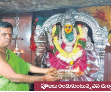
పుణ్యాలంకరణకుంకుమార్చన వన దుర్గామాత