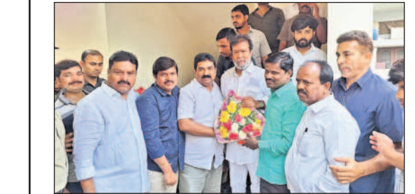
మంత్రి దామోదర రాజనర్సింహుకు శుభాకాంక్షలు తెలుపుతున్న పీఠ్యయూటీఎస్ జిల్లా నేతలు