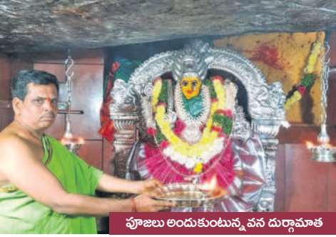
పుణ్యాలయం లంకంపేట వన దుర్గామాత