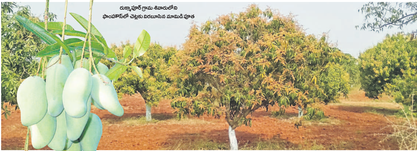
రుత్నాపూర్ గ్రామ శివారులోని ఫాంసోన్ లో చెట్లకు విరబూసిన మామిడి పూత