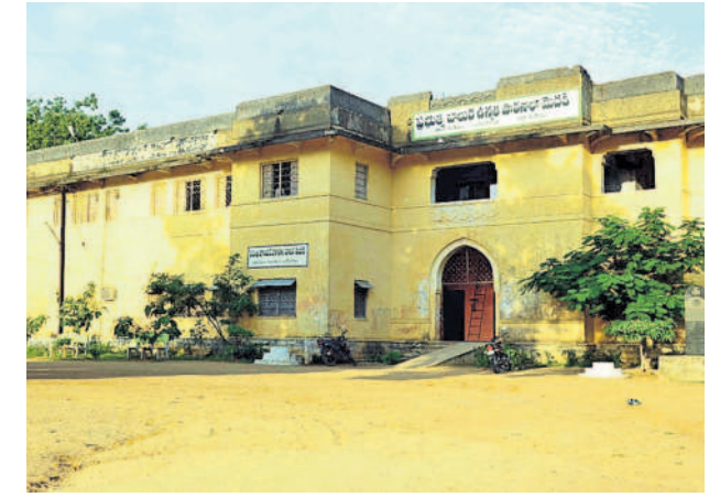
సోలార్ ప్లాంట్లకు ఎంపికైన పాఠశాలలు

ఉమ్మడి మెదక్ జిల్లాలో ఎంపికైన పాఠశాలలు మెదక్ జిల్లాలో 230 పాఠశాలలు సంగారెడ్డిలో జిల్లాలో 348 పాఠశాలలు నిల్లిమల జిల్లాలో 322 పాఠశాలలు