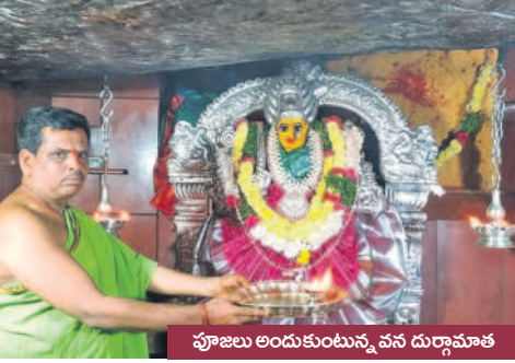
పుణ్యాలంకనం చేసిన దుర్గామాత