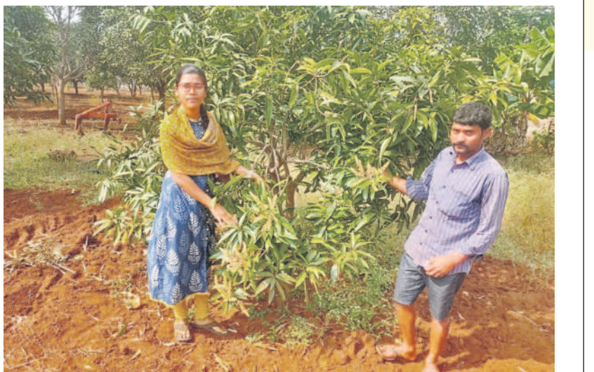
మామిడి తోటను పరిశీలిస్తున్న ఉద్యాన శాఖాధికారి

ఉంచాలి. దీంతో కలుపు మొక్కల నివారణ ఈజీగా ఉంటుంది. మొక్కలకు తగినంత తేమ అందుబాటులో ఉంటుంది. వాతావరణ పరిస్థితులను బట్టి మొక్కలకు ఎరువులు అందించాలి. మామిడి తోటల్లో ప్రధానంగా జింక్ లోపం వచ్చే అవకాశాలు ఉన్నాయి. దీని నివారణకు లీటరు నీటిలో 5 గ్రాముల జింక్ సల్ఫేట్ కలిపి పిచికారి చేసుకోవాలి. ఇనుపు దాకు లోపం వచ్చినట్లయితే అకులు పచ్చదనం కోల్పోయి తెల్లగా పారిపోతాయి. దీని నివారణకు 2.5 గ్రా. పెర్రెన్ సల్ఫేట్ లీటర్ నీటిలో కలిపి పిచికారి చేసుకోవాలి. మామిడి తోటలో కలుపు సమస్యను నివారించేందుకు పాపా సల్ఫేట్ 8 మీ.లీ లేదా ఆమోనియం సల్ఫేట్ 20 గ్రాముల చొప్పున లీటర్ నీటిలో కలుపుకొని పిచికారి చేయాలి. మామిడి మొక్కలపై పడకుండా జాగ్రత్తలు తీసుకోవాలి. చెట్ల కొమ్మల అకులతో సరైన సూర్యరశ్మి చెట్లకు అందక పండ్లని తయారు చేసుకునే సామర్థ్యాన్ని కోల్పోతాయి. నీపివర, లాఫర్ వంటి పరికరాలు ఉపయోగించాలి. మామిడి పూతలో ప్రతి పూల గుత్తిలో 4- 6 వేల వరకు పూలుంటాయి. ఇందులో 1- 3 పూలే కాయగా వృద్ధి చెందుతాయి. మామిడి తోటల్లో పూత, మొగ్గ ఎర్రదైన తరువాత పై పాటుగా ఎరువులు వేసుకోవాలి. చెట్టు వయసు బట్టి సాధారణంగా 500 గ్రాముల నుంచి ఒక కిలో యూరియా, మూర్లేట్ ఆఫ్ ఫాస్ఫేట్ ఎరువులను వేపపండితో కలిపి వేయాలి. అలా వేసిన తరువాత 15 రోజుల వ్యవధిలో తవలివ్వాలి. పిండి కట్టిన నాటి నుంచి కాయ కోత వరకు అనేక కారణాలతో మూడు దశల్లో పిండిలు, కాయలు రాలుతుంటాయి. పిండిలు రాలకుండా ఉండేందుకు చెట్లకు 20-30 కోజుల వ్యవధిలో రెండు, మూడుసార్లు నీటి తడులివ్వాలి. సాగునీటి సౌకర్యం లేనివారు యూరియా డ్రావేబుల్ను పిచికారి చేసుకోవాలి. పిండి రాలుడు ఉద్ధరించి ఎక్కువగా ఉంటే 4.5 లీటర్ల నీటిలో 1 మీ.లీ ఫ్లూనోపిక్వి కలిపి పిచికారి చేసుకుంటే మంచిది.