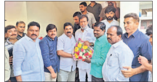
మంత్రి దామోదర రాజనర్సింహకు శుభాకాంక్షలు తెలుపుతున్న పీఠ్యయూటీఎస్ జిల్లా నేతలు