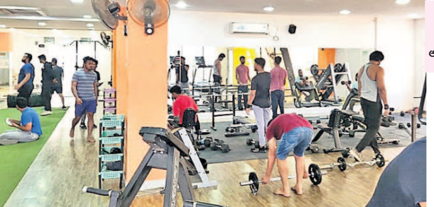
ఆరోగ్య రక్షణకు వాకింగ్, జాగింగ్, జిమ్, యోగా ఎంతో మేలు చిన్నారుల నుంచి వృద్ధుల వరకూ వ్యాయామం తప్పనిసరి ఆహారంతో సరైన నియమాలు పాటించి మేలుపొందుతారు

పిల్లలు, పెద్దలు, వృద్ధులు, పురుషులు, స్త్రీలు, ధనికులు, సాధారణ, మధ్యతరగతి కుటుంబాలు అనే బేదాలు లేకుండా వారికున్న ఆసుకలకు అన్ని వ్యాధులకు వీలకీ సమయం కేటాయించాలి అవసరం ఉంది. ఆరోగ్య పరిరక్షణకు వీలకీ, మందుల వాడకానికీ పరిమితం కాకుండా వాకింగ్, జాగింగ్ తో పాటు జిమ్, యోగా ఇతర మానసిక, శారీరక అలవాట్లకు సంబంధించిన వ్యాయామాలు చేస్తూ పుష్టికరమైన సంతృప్తికర ఆహారం, పండ్లు, పండ్ల రసాలు తదితర పదార్థాలు సమపాక్షితో తీసుకుంటే ఎటువంటి ప్రాణాంతక వ్యాధులు, జబ్బులకైనా చెక్ పెట్టుకున్నాడే వైద్యులు, వ్యాయామ నిపుణుల అభిప్రాయం.