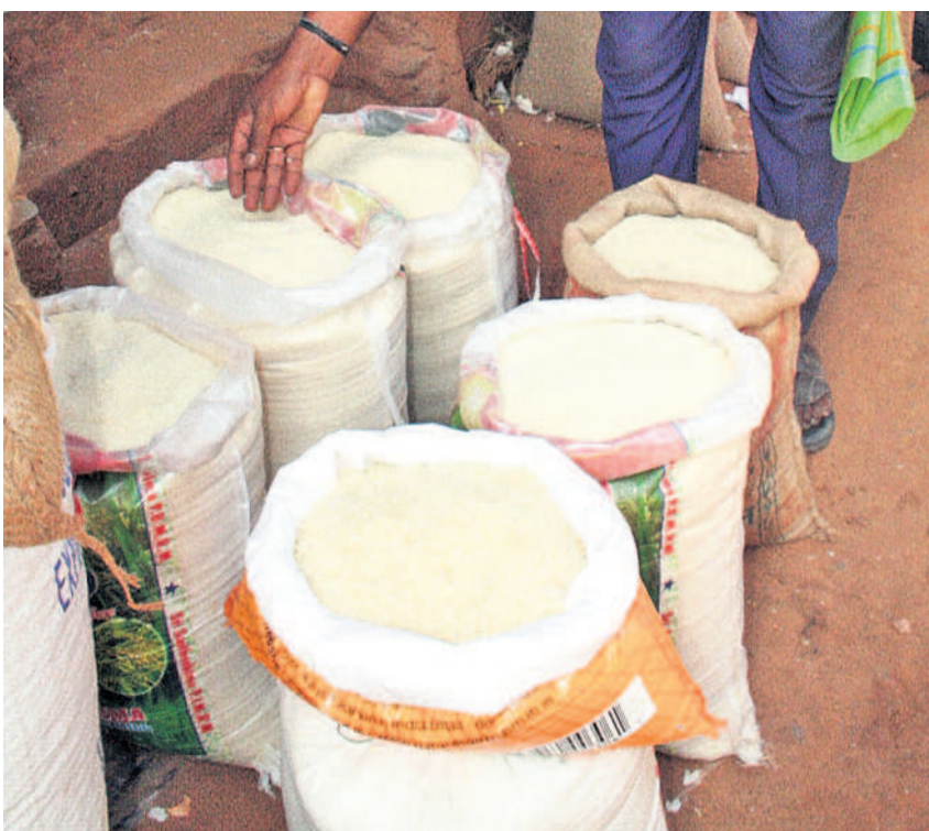
క్వింటాలుకు రూ. 700 నుంచి రూ. వెయ్యి వరకు పెరుగుదల

రానున్న రోజుల్లో సన్న బియ్యం ధరలు మరింత పెరిగే అవకాశం లేకపోలేదని వ్యాపారులు పేర్కొంటున్నారు. రైతులు విక్రయించిన సన్న రకాల ధాన్యాన్ని మిల్లర్లు స్టాక్ చేసి పెట్టుకున్నారు. దీంతో ధరలు వ్యాపారుల నియంత్రణలోనే ఉండనున్నాయి. బియ్యం అమ్మకాలన్నీ ఇప్పుడు బ్రాండ్ పైనే సాగుతున్నాయి. రైతులు పండించే ధాన్యాన్ని మిల్లింగ్ చేసి రకరకాల పేర్లతో మా రైట్లో విక్రయిస్తున్నారు. కొందరు పెద్ద మిల్లర్లు రైతుల నుంచి సన్నాలు కొని మిల్లింగ్ చేశాక బ్రాండ్ ముద్రించి పైవేట్ దుకాణాలకు సరఫరా చేస్తున్నారు. సన్న బియ్యం స్టాక్ అంతా వ్యాపారుల గుప్పిట్లోనే ఉండడంతో వచ్చే రోజుల్లో బియ్యం ధరలు మరింతగా పెరుగునున్నాయి. జిల్లాలో సన్నాల సాగు తగ్గడం.. మిగ్ జాంతుఫాన్ తో పరి పంటలు దెబ్బతినడం ఒక కారణమైతే వ్యాపారులు బియ్యాన్ని బయటి రాష్ట్రాలకు తరలించడం మరో కారణమని పలువురు పేర్కొంటున్నారు.