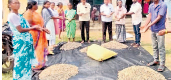
సేకరించిన ముష్టి గింజలను పరిశీలిస్తున్న అధికారులు