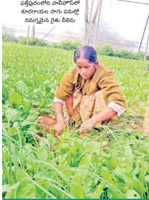
పత్తేపురంలోని పాలిహౌస్ లో కూరగాయల సాగు పనుల్లో నిమగ్నమైన రైతు నీలిమ