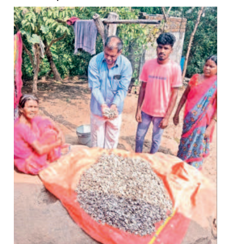
ముష్టిగింజలు సేకరించిన వృద్ధురాలు

అటవీ ఉత్పత్తులతో అడవి బడ్డలకు ఉపాధి కలుగుతున్నది. ముష్టి గింజల సేకరణ వారికి కల్పితరువుగా మారింది. వీటిని వివిధ ఔషధాల తయారీలో వినియోగిస్తుండడంతో డిమాండ్ పెరిగింది. అటవీ ప్రాంతాల్లో విరివిగా లభించే ముష్టి గింజలను ఈ నెల, వచ్చే నెలలోనే ఎక్కువగా సేకరిస్తారు. వాటిని ఏల, వచ్చే నెలలోనే ఎక్కువగా జరుగు తుంది. చెట్ల నుంచి కింద రాలిన ముష్టి కాయలను ముంపగా సేకరిస్తారు. వాటిని పగులుగొట్టి గింజలను తీసి ఎండబెడుతారు. తర్వాత వాటిని విక్రయిస్తారు. కొందరికే చెట్లపైకి ఎక్కి పండగా మాచిన కాయలను రాల్చుకుంటారు. వాటిని ఏరుకోవడం, గింజలను ఎండబెట్టడం చేస్తుంటారు. వీటిని మార్కెట్లో ఇతరులు ఎవరూ కొనే అవకాశం లేనందున జీసీసీ మాత్రమే కొనుగోలు చేస్తుంది. ఆదాయం కల్పించే ముష్టిగింజల చెట్లను సరకడం చేయరు. చెట్లు పుష్పం ఉండడంలో ఎక్కువ కాయలు లభించే అవకాశాలు ఉన్నాయి. అడవిలో ఉండే ఈ చెట్ల వడ్డకు తరచూ వారు వెళ్తున్నందున నేరగా వాటి వడ్డకే వెళ్లి సేకరిస్తారు. ఇవి వివహారితమైన గింజలు కావడం వల్ల వీటి పట్ల సేకరణదారులు జాగ్రత్తలు తీసుకుంటారు. ఇండ్లలో నిల్వ చేసుకోవడం, చిన్న బిల్లలకు దూరంగా ఉంచడం చేస్తుంటారు.