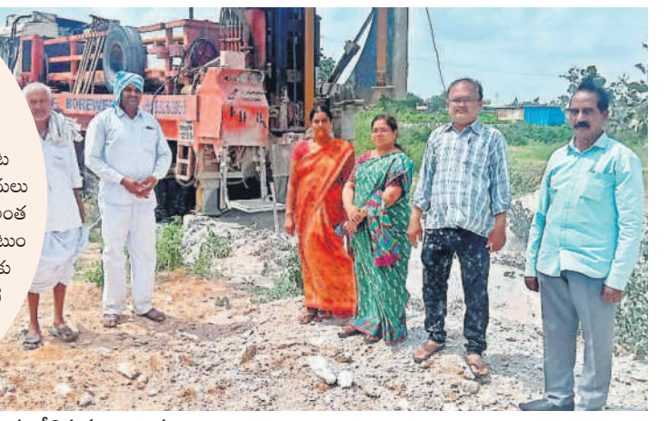
బోరును పరిశీలిస్తున్న అధికారులు

నేటి ఆధునిక జీవితంలో మనుషులకు సెల్ ఫోన్ తో వీడదీయరాని బంధం ఏర్పడింది. ప్రతి సెకను లంటి పెట్టుకొని ఉండాలన్న ఆసక్తి ఎక్కువ మందిలో కనిపిస్తున్నది. అయితే.. ఏ పరిస్థితుల్లో ఉన్నా కాలర్ లిస్ట్ చేయాలనే ఆత్మక అనేక అనర్థాలకు దారి తీస్తున్నది. సెల్ ఫోన్ మాట్లాడుతూ డ్రైవింగ్ చేయడం ప్రమాదకరం, నేరమని తెలిసినా కొందరు మానడం లేదు. సెల్ ఫోన్ వాడుతూ ముందూ వెనుకా గమనించకుండా ఇబ్బరాజ్యంగా వాహనాలు నడుపుతున్నారు. ట్రాఫిక్ రిద్దీలోనూ సెల్ ఫోన్ మాట్లాడుతూ ప్రమాదాలకు కారణమవుతున్నారు. వారే కాకుండా ఎదుటి వారిని ప్రమాదంలోకి నెట్టి తీవ్ర నష్టాన్ని మిగుల్చుతున్నారు. - నేరేడుచర్ల, డిసెంబర్ 17