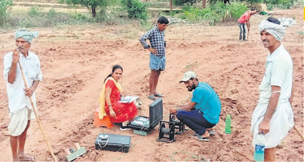
నారాయణపురం మండలం పల్లెగట్టుతండాలో బోరు వేసేందుకు సర్వే చేస్తున్న జియాలజిస్ట్

లక్ష్యంగా తీసుకొచ్చిన ఈ పథకాన్ని గిరిజన సంక్షేమ శాఖ అమలు చేస్తున్నది. నగదు బదిలీ ద్వారా కాకుండా ప్రత్యేకంగా గిరిజన రైతులకు రాష్ట్ర ప్రభుత్వం సహాయ సహకారాలు అందిస్తున్నది. సొంతంగా బోరు, మోటరు, విద్యుత్ సౌకర్యం కల్పించుకోలేక మెట్ట పంటలు సాగు చేసుకునే గిరిజనుల భూములకు ఈ పథకం ద్వారా సాగు నీటి వసతి కల్పిస్తారు. గిరిజన రైతుల పొలాలకు బోర్లు వేయిస్తారు. బావులు తవ్విస్తారు. బోర్లు ఉన్న రైతులకు విద్యుత్ సదుపాయం కల్పిస్తారు. ఉపాధి హామీ పనుల ద్వారా బండరాళ్లు, పిప్పి మొక్కలు, స్ట్రావ్లు, తొలగించి బంజరు భూములను సాగుకు యోగ్యంగా మారుస్తారు. పండ్ల మొక్కల సరఫరాతోపాటు సాగులో సలహాలు కూడా అందిస్తారు.