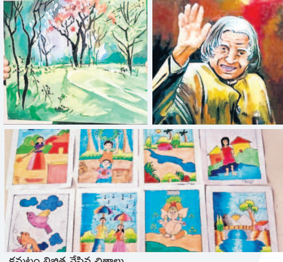
కమలం లిఖిత వేసిన చిత్రాలు