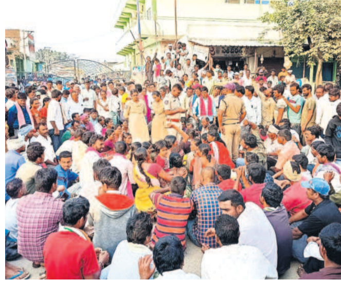
సోమవారం కేసముద్రం మార్కెట్లో ధాన్యం ధరపై ఆందోళనకు దిగిన రైతులు