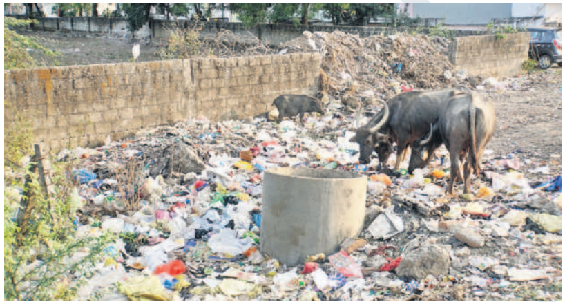
ఆదిలాబాద్ జిల్లాకేంద్రంలోని రాంనగర్ ఆపార్ట్ మెంట్ సమీపంలో పేరుకుపోయిన చెత్తచెదారం