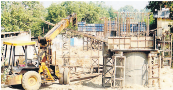
కొనసాగుతున్న రైల్వే వంతెన పనులు