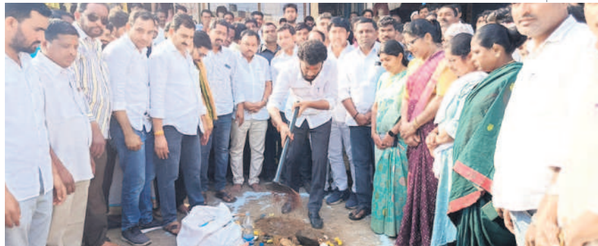
ఇచ్చోడ : రోడ్డు పనులకు భూమి పూజ చేస్తున్న బోధ ఎమ్మెల్యే అనిల్ జాదవ్