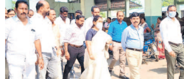
ఖమ్మం వ్యవసాయ మార్కెట్ యార్లూలను పరిశీలిస్తున్న మార్కెటింగ్ డైరెక్టర్

పరిశీలించారు. నిర్మాణాలన్నీ నిబంధనల ప్రకారమే ఉండాలని సూచించారు. అనంతరం పత్తియార్లను సందర్శించారు. రైతులు తీసుకోవాల్సిన పత్తింట్లను