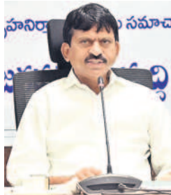
మాట్లాడుతున్న మంత్రి పొంగులేటి

కరుల సమావేశంలో ఆయన మాట్లాడారు. రాష్ట్ర ఆర్థిక పరిస్థితి ఇబ్బందికరంగా ఉన్నప్పటికీ ప్రజా సంక్షేమ పథకాలకు మాత్రం ఆటంకం లేకుండా అమలు చేస్తామని అన్నారు. ఆరు గ్యారంటీల్లో రెండైన మహిళలకు ఆర్డీసీ బస్సులో ప్రయాణం, రాజీవ్ ఆరోగ్య శ్రీ పథకంలో వైద్య ఖర్చుల పరిమితిని రూ.10 లక్షలకు పెంచడం వంటివి అమలు చేస్తున్నామని అన్నారు. ఈ నెల 28 వరకు