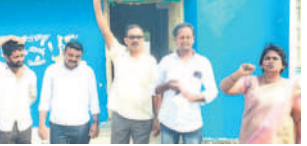
నిరసన తెలుపుతున్న పాల సేకరణదారులు

రఘునాథపాలెం, డిసెంబర్ 18: కార్యాలయం సమయం అయినప్పటికీ అధికారులు రాకపోవడంపై పాల సేకరణదారులు సోమవారం విజయ డెయిరీ ఎదుట నిరసన చేపట్టారు. కొద్ది రోజులుగా పాల బిల్లుల చెల్లింపు కపోవడంతో నేరుగా అధికారులను కలిసి ప్రశ్నించేందుకు పలువురు పాల సేకరణదారులు సోమవారం ఖమ్మంలోని డెయిరీ కార్యాలయానికి వచ్చారు. దీంతో 11 గంటలు దాటితూ ఒక్క అధికారులు కూడా కార్యాలయానికి రాకపోవడంతో పాల సేకరణదారులు ఆసహనం వ్యక్తం చేశారు. ఫోన్ చేసినా నిర్లక్ష్యం సమాధానం చెప్పడంతో వారంతా కలిసి కార్యాలయం ఎదుట నిరసన తెలియజేశారు. పాల ఉత్పత్తిదారులు, సేకరణదారులు పాల్గొన్నారు.