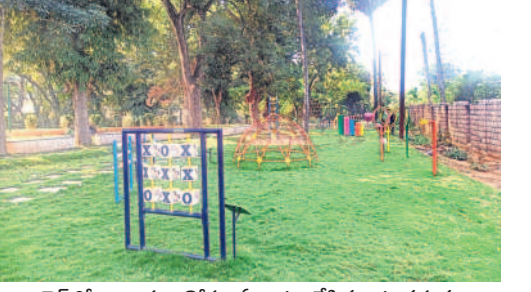
గార్డెన్ లో బిన్కారుల కోసం ఏర్పాటు చేసిన ఆట వస్తువులు

వరంగల్ లోని కాకతీయ మ్యూజికల్ గార్డెన్ పునరుద్ధరణ పనుల్లో వేగం పుంజుకుంది. దాదాపు 90శాతం పూర్తవడంతో త్వరలో ప్రారంభించేందుకు అధికార యంత్రాంగం సన్నాహాలు చేస్తోంది. రూ.కోటి 60 లక్షల కూడా నిడులతో గార్డెన్ పనులు చేపట్టగా పూర్వవైభవం సంతరించుకొని చూడ చక్కని అందాలతో ఆకట్టుకోనున్నది. - వరంగల్, డిసెంబర్ 18