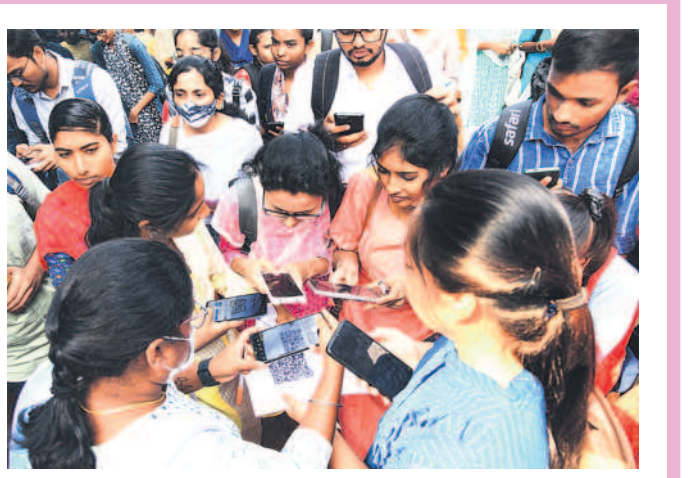
క్యూఆర్ కోడ్ స్కాన్ చేస్తున్న యువతీయువకులు

ప్రస్తుతం పచ్చి, పండు మిర్చికి మార్కెట్ లో మంచి డిమాండ్ ఉంది. తీతో ఇటు పంట సాగు చేసిన రైతులకు నిరులు కురిపిస్తుండగా, కూలీలకూ చేతినిండా పనిదొరుకుతోంది. ఒకప్పుడు పెట్టుబడికి ఇబ్బంది పడే పరిస్థితి ఉండగా ప్రస్తుతం ఆశించిన దిగుబడి వస్తుండడంతో ఇతర ప్రాంతాలకు సైతం ఎగుమతి అవుతోంది. క్వింటాల్ కు రూ.3వేల ధర వలు కుతుండడంతో మిర్చి రైతుల్లో సంతోషం కనిపిస్తోంది. - వాజేడు, డిసెంబర్ 18