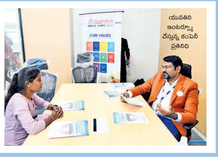
యువతని ఇంటర్వ్యూ చేస్తున్న కంపెనీ ప్రతినిధి