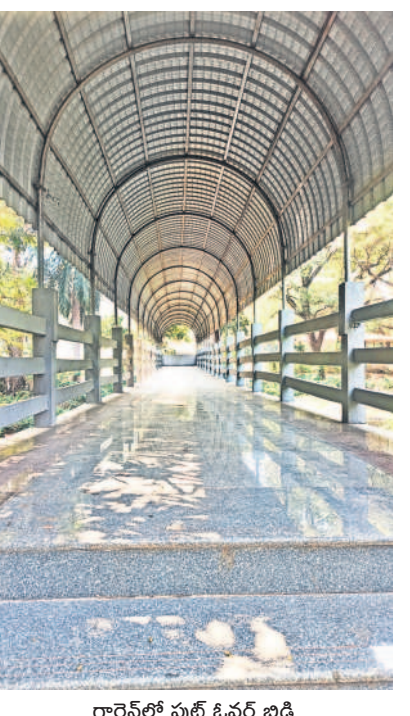
గార్డెన్ లో పులే ఓవర్ బ్రిడ్జి

ములుగు జిల్లా వాజేడు మండలంలోని పలు గ్రామాల్లో రైతులు ఎక్కువగా మిర్చి సాగు చేశారు. ఇందులో 341, ఇండికా, వండర్ హాట్ తదితర రకాల పచ్చిమిర్చి, పండు మిర్చి ఉన్నాయి. ఇందులో కాతక వచ్చిన పచ్చి మిర్చి, పండు మిర్చికి మార్కెట్ లో మంచి డిమాండ్ ఉంది. బయట మార్కెట్ కు ఎగుమతులు చేస్తూ ఆశించిన లాభాలు గడిస్తున్నారు. మిర్చి సాగుకు ఎకరూ రూ.2లక్షలపైనే ఖర్చు అవుతుండగా గతంలో రైతులు పెట్టుబడులకు ఇబ్బంది పడేవారు. కానీ ఇప్పుడు మిర్చి పంట వేసిన మూడు నెలల్లో పచ్చి మిర్చి కోతకు సిద్ధంగా ఉండడంతో రైతులు కూలీల సహాయంతో పచ్చి మిర్చిని కోయించి వాటిని ప్రత్యేకంగా గ్రేడింగ్ చేయించి తూకం వేసి సంచల్లో నింపి అమ్ముతున్నారు. క్వింటా పచ్చి మిర్చికి మార్కెట్ లో రూ.2800, పండు మిర్చి రూ.3వేల వరకు ధర పలుకుతోంది. దీంతో చిన్న, సన్నకారు రైతులు పచ్చిమిర్చిని చేను వద్దకు వచ్చే వ్యాపారులకు విక్రయించి పంటను సాగుచేసుకుంటున్నారు. దీని వల్ల తమకు బయట పెట్టుబడి తిచ్చే బాధ కొంత మేర తగ్గిందని చెబుతున్నారు. అమ్మిన మిర్చి డబ్బులతో పంటకు పెట్టుబడి సాంతంగా పెట్టుకుంటున్నామని రైతులు పేర్కొంటున్నారు. విడి వేలూ పచ్చి మిర్చి, పండు మిర్చి అమ్మకాల వల్ల రైతులకు నెటివ్ సగం అందుతుండడంతో వారు అసందం వ్యక్తం చేస్తున్నారు. మండలంలో మిర్చి సాగుచేస్తున్న రైతుల వద్దకు బయట నుంచి వ్యాపారులు వచ్చి మిర్చి కోను గోలు చేసి హైడ్రాబాద్, వరంగల్, నర్సంపేట తో పాటు ఆంధ్రప్రదేశ్ లోని విజయవాడ తదితర ప్రాంతాలకు తరలిస్తున్నారు. పచ్చి, పండు మిర్చికోత కోసే కూలీలకు సైతం చేతినిండా పని దొరుకుతుండడంతో వారు సైతం సంతోషం వ్యక్తం చేస్తున్నారు.