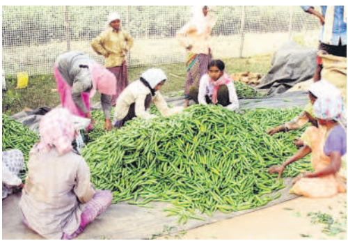
కోసిన పచ్చిమిర్చిని గ్రేడింగ్ చేస్తున్న కూలీలు