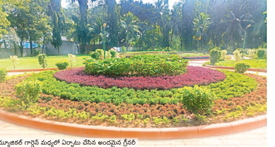
మ్యూజికల్ గార్డెన్ మధ్యలో ఏర్పాటు చేసిన అందమైన గ్రీనరీ

తుది దశకు అభివృద్ధి పనులు కాకతీయ మ్యూజికల్ గార్డెన్ అభివృద్ధి పనులు చివరి దశకు చేరుకున్నాయి. మ్యూజికల్ గార్డెన్ లో ముందుభాగంలో గ్రీనరీ పనులు దాదాపుగా పూర్తిచేశారు. చిన్నారుల కోసం ఆట వస్తువులను ఏర్పాటుచేశారు. పుటేపాతలను ట్రైల్ తో అందంగా తీర్చిదిద్దారు. మ్యూజికల్ గార్డెన్ లోని రెండు ట్రిడ్డిలకు అందగా ముస్తాయి చేశారు. గతంలో ట్రిడ్డిలకు పైకప్పు ఉండేది కాదు. పునరుద్ధరణలో బాగాగా ఇప్పుడు ట్రిడ్డిలకు పైకప్పులతో పాటు గ్రాస్ బ్లెడ్స్ వేశారు. దీంతో ట్రిడ్డిలు అందంగా కనిపిస్తున్నాయి.