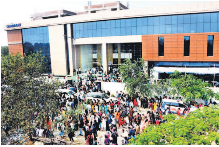
ఉద్యోగార్థులతో క్వారంటైన్ కంపెనీ వద్ద కోలాహలం