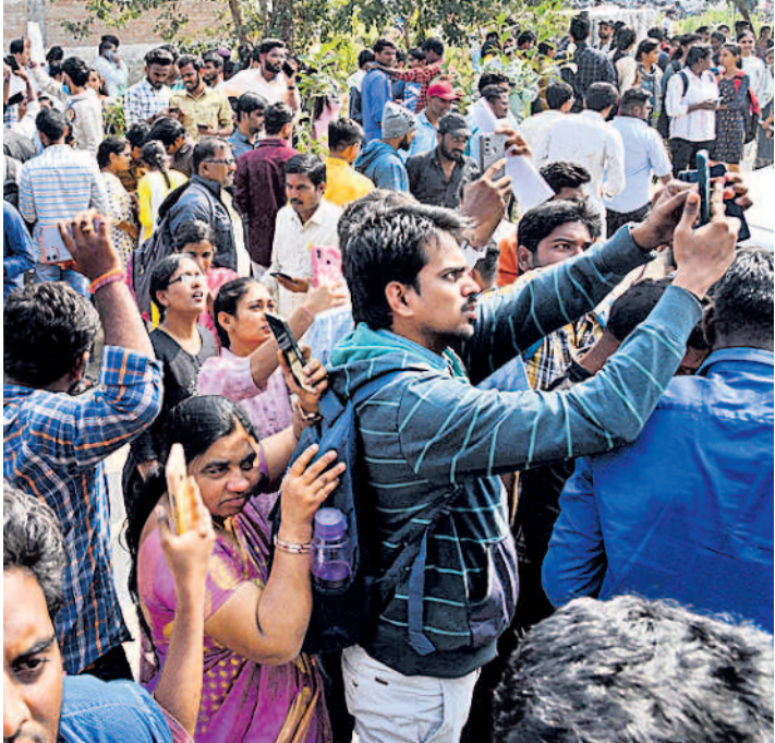
క్యూఆర్ కోడ్ను స్కాన్ చేస్తున్న ఉద్యోగార్థులు