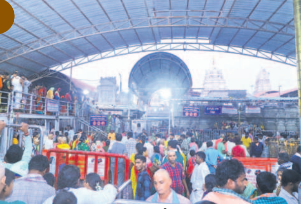
ఆలయ ప్రాంగణంలో భక్తులు

వేములవాడ టౌన్, డిసెంబర్ 18: వేములవాడ శ్రీ సార్వభౌమ రాజారాజేశ్వర స్వామివారి ఆలయం సోమవారం పోటెన్షియల్. 50వేలకుపైగా భక్తులతో తీరికీలాడింది. దీంతో ఆలయ పరిసరాలు శివనామస్మరణతో మార్పొయి. వేకువజాము నుంచే భక్తులు పవిత్ర దర్శనంకోసం స్నానాలు ఆచరించి, రాజన్నకు కోడెమొక్క చెల్లించుతున్నారు. రద్దీ దృష్ట్యా అధికారులు గర్భ గుడిలో అర్చిత సేవలను నిలిపివేశారు. భక్తులు క్యూలో గంటల తరబడి నిలబడి స్నానమారిన దర్శించుతున్నారు. వివిధ సేవల ద్వారా ₹28లక్షల ఆదాయం సమకూరిందని అధికారులు వెల్లడించారు. అనుబంధ దేవాలయాల్లోనూ రద్దీ కనీపించింది. భక్తులకు ఇబ్బందులు కలుగకుండా పట్టణ సీఐ కారకాకర్ గట్టి బందోబస్తు ఏర్పాటు చేశారు.