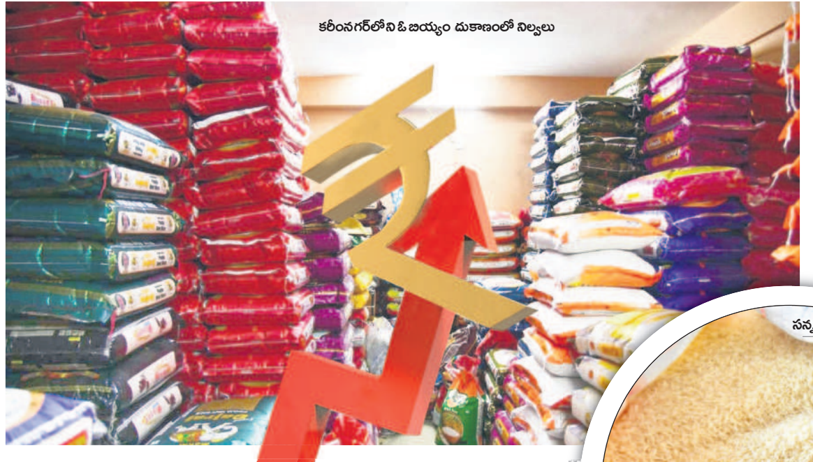
కరీంనగర్ లోని ఓ.బి.బి.బి.బి.బి.బి. బియ్యం దుకాణంలో నిల్వలు