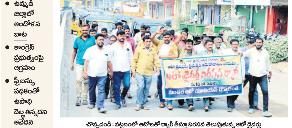
హొప్పందం : పట్టణంలో ఆటోలలో ర్యాలీ తీసుకుని నిరసన తెలుపుతున్న ఆటో డ్రైవర్లు

జగిత్యాల అర్బన్ / చొప్పందం, డిసెంబర్ 18: ఆటో డ్రైవర్ల ఆందోళన కొనసాగుతున్నది. రోజురోజుకూ తీవ్రంగా దారుణం అవుతున్నది. సోమవారం కరీంనగర్ ఉమ్మడి జిల్లా వ్యాప్తంగా అగ్గరాజుకున్నది. కాంగ్రెస్ ప్రభుత్వం ప్రవేశ పెట్టిన ఉచిత బస్సు ప్రయాణ పథకం తెచ్చి తమ పొట్టకొట్టినట్లుంటూ కార్మికులు ఆవేదన వ్యక్తం చేస్తున్నారు. మహాత్మా జవహర్ లాల్ నెహ్రూ వ్యతిరేకం కాదని, కానీ తమకు ఉపాధి కల్పించాలని కోరుతున్నారు. సోమవారం జగిత్యాల డిజిల్ ఆటో సంక్షేమ సంఘం అధ్యక్షులతో జిల్లా కేంద్రంలోని పాఠ బస్టాండ్ నుంచి కల్లెరేట్ దాకా బారీ ర్యాలీ తీశారు. ఆటో యజమాని, డ్రైవర్లకు నెలకు రూ.15వేల ఆర్థిక సహాయాన్ని అందించాలని కోరుతూ ప్రజావాణిలో జగిత్యాల కలెక్టర్ పేజీ యూనిట్ బాషాకు వినవేస్తామని అందజేశారు. రాయలకోట ఆటో డ్రైవర్ల సంఘం అధ్యక్షులతో శాంతియుత నిరసన ప్రదర్శన చేపట్టారు. యాగడపల్లి, గొల్లపల్లిలో పెద్ద సంఖ్యలో ఆటో డ్రైవర్లు నిరసన ర్యాలీ తీశారు. అలాగే చొప్పందం పట్టణంలో మండల ఆటో యూనియన్ అధ్యక్షులతో బారీ ర్యాలీ తీశారు. అనంతరం ఆయనోట్ల కార్మికులు మాట్లాడారు. బస్సు ఫ్రీతో తమకు గొప్ప లక్ష్యం వేరయిందని, ఆటోలకు కంటిమీద కట్టలేని పరిస్థితి దాపురించిందని ఆవేదన చెందారు. ప్రభుత్వం తమను ఆడుకోవాలని, లేదంటే తమపోరాటాన్ని మరింత ఉధృతం చేస్తామని హెచ్చరించారు.