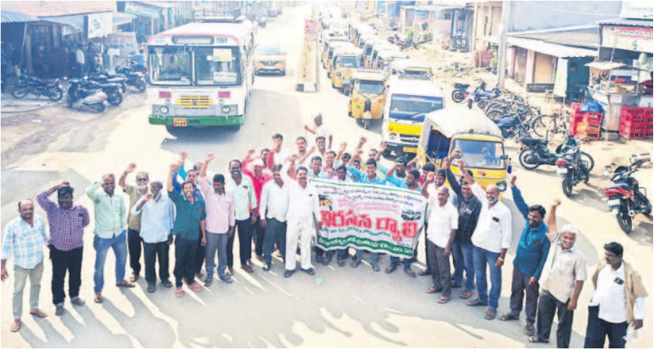
ధర్మపురి : పెగడపల్లిలో ర్యాలీ తీసి నివాదాలు చేస్తున్న ఆటో డ్రైవర్లు

సన్న బియ్యం ధరలు విపరీతంగా పెరుగుతున్న నేపథ్యంలో కొందరు మిల్లర్లు, ట్రేడర్లు తమ మార్యాజాలాన్ని ప్రదర్శిస్తున్నారనే ఆరోపణలు వినిపిస్తున్నాయి. జిల్లాలో వచ్చిన సన్న రకం వడ్డు దిగుబడిని ఇతర రాష్ట్రాల వ్యాపారులు తీసుకెళ్తుండగా.. మన జిల్లా వ్యాపారుల మాత్రం ఎక్కువగా నిజామాబాద్, మిర్యాలగూడ జిల్లాల నుంచి దిగుమతి చేసుకుంటున్నారు. కరీంనగర్ జిల్లాలోని జమ్మికుంట మిల్లర్లు కొందరు సన్న బియ్యం మరాడించి విక్రయించే వారు. కానీ, ఇప్పుడు ఆ పరిస్థితి కనిపించడం లేదు. స్థానికంగా కేవలం 30 శాతం మొత్తమే సన్న బియ్యం మార్కెట్ కు వస్తున్నది. ఈ నేపథ్యంలో కొందరు ట్రేడర్లు తమ మార్యాజాలాన్ని ప్రదర్శిస్తున్నారనే ఆరోపణలు వస్తున్నాయి. కొన్ని మిల్లర్లు సాంబమసూరిలో వివిధ రకాల వడ్డును మరాడించివచ్చడం వల్ల బియ్యం కార్మిటీని మార్చుకుంటున్నట్లు తెలుస్తున్నది. కొన్ని వ్యాపారులు కూడా కవర్లు మార్చుతూ కార్మిటీ తప్పకుండా ఉన్న బియ్యాన్ని ఎక్కువ ధరకు విక్రయం చేస్తున్నట్లు తెలుస్తున్నది. అంతే కాకుండా బియ్యంపై జీఎస్టీ విధించినప్పటి నుంచి 28 కిలోల బస్తాలో బియ్యం విక్రయిస్తున్నారు. అయితే, కొనుగోలు చేసిన చాలా బియ్యం సంవత్సరం 25 కిలోల కంట ఉంటాయని ఆరోపణలు వస్తున్నాయి. ఈ భారమంతా సామాన్య మధ్య తరగతి ప్రజలే భరించాల్సి వస్తున్నది.