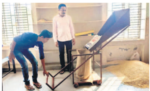
అవిష్కరణను పరిశీలిస్తున్న అధికారి (ఫైల్)

పాఠశాల స్థాయి నుంచి విద్యార్థుల్లోని శాస్త్రీయ ప్రావీణ్యం వెలికి తీసేందుకు వైజ్ఞానిక ప్రదర్శనలు ఎంతో ఉపయోగపడుతున్నాయి. ఈ నేపథ్యంలో ఈ విద్యా సంవత్సరం ప్రదర్శనలను నిర్వహించేందుకు విద్యాశాఖ సన్నాహాలు చేస్తున్నది. ఈ మేరకు ఆయా పాఠశాలల ప్రధానోపాధ్యాయులు, గైడ్ టీచర్లు సూతన ఆవిష్కరణలను ప్రోత్సహించే దిశగా విద్యార్థులను సన్నద్ధం చేస్తున్నారు. 2023-24 విద్యా సంవత్సరంలో ఒక అంశంపై అందుకు అనుగుణంగా ప్రయోగాలను రూపకల్పన చేయాల్సి ఉంటుంది. కాగా, ఈ యేడాది పర్యావరణానికి పెద్దపీట వేసే ప్రధాన అంశంగా, టెక్నాలజీ ఫర్ సొసైటీగా నిర్దేశించారు.