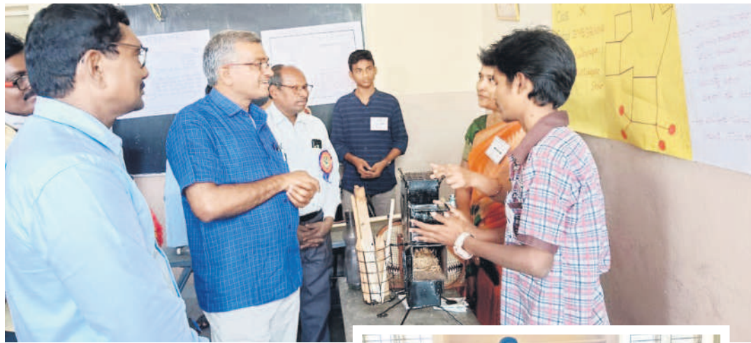
సెన్సైటివ్ లో విద్యార్థులతో మాట్లాడుతున్న అధికారులు

పాఠశాల స్థాయి నుంచి విద్యార్థుల్లోని శాస్త్రీయ ప్రావీణ్యం వెలికి తీసేందుకు వైజ్ఞానిక ప్రదర్శనలు ఎంతో ఉపయోగపడుతున్నాయి. ఈ నేపథ్యంలో ఈ విద్యా సంవత్సరం ప్రదర్శనలను నిర్వహించేందుకు విద్యాశాఖ సన్నాహాలు చేస్తున్నది. ఈ మేరకు ఆయా పాఠశాలల ప్రధానోపాధ్యాయులు, గైడ్ టీచర్లు సూతన ఆవిష్కరణలను ప్రోత్సహించే దిశగా విద్యార్థులను సన్నద్ధం చేస్తున్నారు. 2023-24 విద్యా సంవత్సరంలో ఒక అంశంపై అందుకు అనుగుణంగా ప్రయోగాలను రూపకల్పన చేయాల్సి ఉంటుంది. కాగా, ఈ యేడాది పర్యావరణానికి పెద్దపీట వేసే ప్రధాన అంశంగా, టెక్నాలజీ ఫర్ సొసైటీగా నిర్దేశించారు.