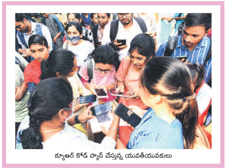
క్యూఆర్ కోడ్ స్కాన్ చేస్తున్న యువతీయువకులు

ప్రస్తుతం పచ్చి, పండు మిర్చికి మార్కెట్ లో మంచి డిమాండ్ ఉంది. దీంతో ఇటు పంట సాగు చేసిన రైతులకు నిరులు కురిపిస్తుండగా, కూలీలకూ చేతినిండా పనిదొరుకుతోంది. ఒకప్పుడు పెట్టుబడికి ఇబ్బంది పడే పరిస్థితి ఉండగా ప్రస్తుతం ఆశించిన దిగుబడి వస్తుండడంతో ఇతర ప్రాంతాలకు సైతం ఎగుమతి అవుతోంది. క్వింటాల్ కు రూ.3వేల ధర వలు కుతుండడంతో మిర్చి రైతుల్లో సంతోషం కనిపిస్తోంది. - వాజేడు, డిసెంబర్ 18