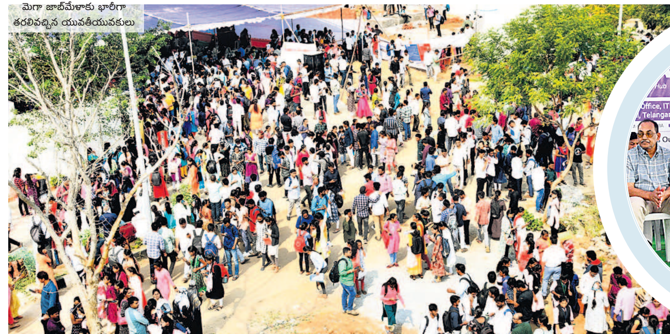
మెగా జాబ్ మేళాకు భారీగా తరలివచ్చిన యువతీయువకులు