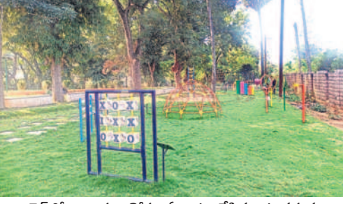
గార్డెన్ లో బిన్నారల కోసం ఏర్పాటు చేసిన ఆట వస్తువులు

వరంగల్ లోని కాకతీయ మ్యూజికల్ గార్డెన్ పునరుద్ధరణ పనుల్లో వేగం పుంజుకుంది. దాదాపు 90శాతం పూర్వవైభవంతో త్వరలో ప్రారంభించేందుకు అధికార యంత్రాంగం సన్నాహాలు చేస్తోంది. రూ.కోటి 60 లక్షల కూడా నిడులతో గార్డెన్ పనులు చేపట్టగా పూర్వవైభవం సంతరించుకొని చూడ చక్కని అందాలతో ఆకట్టుకోనున్నది. - వరంగల్, డిసెంబర్ 18