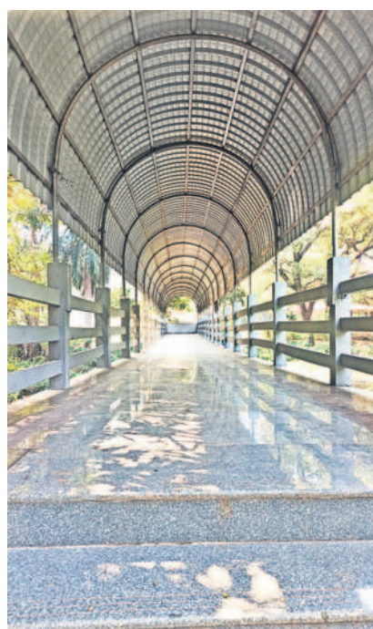
గార్డెన్ లో పులి ఓవర్ బ్రిడ్జి

ములుగు జిల్లా వాజేడు మండలంలోని పలు గ్రామాల్లో రైతులు ఎక్కువగా మిర్చి సాగు చేశారు. ఇందులో 341, ఇండికా, వండర్ హాట్ తదితర రకాల పచ్చిమిర్చి, పండు మిర్చి ఉన్నాయి. ఇందులో కాతక వచ్చిన పచ్చి మిర్చి, పండు మిర్చికి మార్కెట్ లో మంచి డిమాండ్ ఉంది. బయట మార్కెట్ కు ఎగుమతులు చేస్తూ ఆశించిన లాభాలు గడిస్తున్నారు. మిర్చి సాగుకు ఎకరాల రూ.2లక్షలపైనే ఖర్చు అవుతుండగా గతంలో రైతులు పెట్టుబడులకు ఇబ్బంది పడేవారు. కానీ ఇప్పుడు మిర్చి పంట వేసిన మూడు నెలల్లో పచ్చి మిర్చి కోతకు సిద్ధంగా ఉండడంతో రైతులు కూలీల సహాయంతో పచ్చి మిర్చిని కోయించి వాటిని ప్రత్యేకంగా గ్రేడింగ్ చేయించి తూకం వేసి సంచల్లో నింపి అమ్ముతున్నారు. క్వింటా పచ్చి మిర్చికి మార్కెట్ లో రూ.2800, పండు మిర్చి రూ.3వేల వరకు ధర పలుకుతోంది. దీంతో చిన్న, సన్నకారు రైతులు పచ్చిమిర్చిని చేను వద్దకు వచ్చే వ్యాపారులకు విక్రయించి పంటను సాగుచేసుకుంటున్నారు. దీని వల్ల తమకు బయట పెట్టుబడి తిచ్చే బాధ కొంత మేర తగ్గిందని చెబుతున్నారు. అమ్మిన మిర్చి డబ్బులతో పంటకు పెట్టుబడి సాంతంగా పెట్టుకుంటున్నామని రైతులు పేర్కొంటున్నారు. విడి వేలూ పచ్చి మిర్చి, పండు మిర్చి అమ్మకాల వల్ల రైతులకు వేతనం వస్తున్నారని, మండలంలో మిర్చి సాగుచేస్తున్న రైతుల వద్దకు బయట నుంచి వ్యాపారులు వచ్చి మిర్చి కోసు గోలు చేసి హైడ్రాబాద్, వరంగల్, నర్సంపేట తో పాటు ఆంధ్రప్రదేశ్ లోని విజయవాడ తదితర ప్రాంతాలకు తరలిస్తున్నారు. పచ్చి, పండు మిర్చికోత కోసే కూలీలకు సైతం చేతినిండా పని దొరుకుతుండడంతో వారు సైతం సంతోషం వ్యక్తం చేస్తున్నారు.