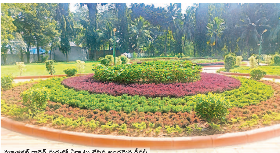
మ్యూజికల్ గార్డెన్ మధ్యలో ఏర్పాటు చేసిన అందమైన గ్రీనరీ

తుది దశకు అభివృద్ధి పనులు కాకతీయ మ్యూజికల్ గార్డెన్ అభివృద్ధి పనులు చివరి దశకు చేరుకున్నాయి. మ్యూజికల్ గార్డెన్ లో ముందుభాగంలో గ్రీనరీ పనులు దాదాపుగా పూర్తిచేశారు. బిన్నారల కోసం ఆట వస్తువులను ఏర్పాటుచేశారు. పులిపాతలను ట్రైల్స్ తో అందంగా తీర్చిదిద్దారు. మ్యూజికల్ గార్డెన్ లోని రెండు ట్రిడ్డిలకు అందగా ముస్తాయి చేశారు. గతంలో ట్రిడ్డిలకు పైకప్పు ఉండేది కాదు. పునరుద్ధరణలో బాగాగా ఇప్పుడు ట్రిడ్డిలకు పైకప్పులతో పాటు గ్రాస్ బ్లెడ్స్ చేశారు. దీంతో ట్రిడ్డిలు అందంగా కనిపిస్తున్నాయి.