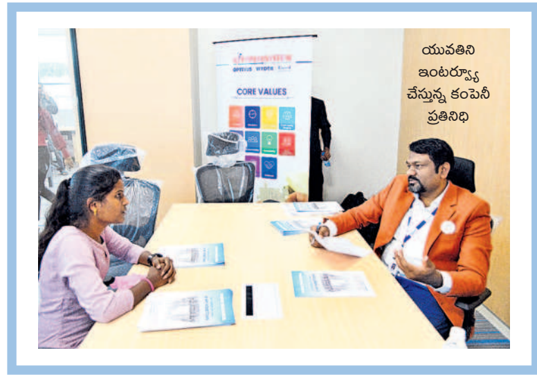
యువతని ఇంటర్వ్యూ చేస్తున్న కంపెనీ ప్రతినిధి