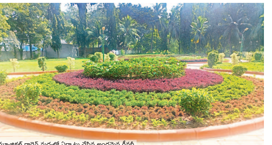
మ్యూజికల్ గార్డెన్ మధ్యలో ఏర్పాటు చేసిన అందమైన గ్రీనరీ

తుది దశకు అభివృద్ధి పనులు కాకతీయ మ్యూజికల్ గార్డెన్ అభివృద్ధి పనులు చివరి దశకు చేరుకున్నాయి. మ్యూజికల్ గార్డెన్ లో ముందుభాగంలో గ్రీనరీ పనులు దాదాపుగా పూర్తిచేశారు. బిన్యూరుల కోసం ఆట వస్తువులను ఏర్పాటుచేశారు. పుట్టపాతలను టైల్స్ తో అందంగా తీర్చిదిద్దారు. మ్యూజికల్ గార్డెన్ లోని రెండు ట్రిడ్డిలకు అందగా ముస్తాయి చేశారు. గతంలో ట్రిడ్డిలకు పైకప్పు ఉండేది కాదు. పునరుద్ధరణలో బాగాగా ఇప్పుడు ట్రిడ్డిలకు పైకప్పులతో పాటు గ్రానైట్ టైల్స్ చేశారు. దీంతో ట్రిడ్డిలు అందంగా కనిపిస్తున్నాయి.