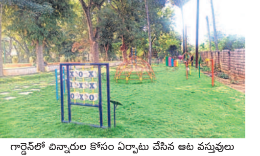
గార్డెన్ లో బిన్యూరుల కోసం ఏర్పాటు చేసిన ఆట వస్తువులు

వరంగల్ లోని కాకతీయ మ్యూజికల్ గార్డెన్ పునరుద్ధరణ పనుల్లో వేగం పుంజుకుంది. దాదాపు 90శాతం పూర్వవైభవంతో త్వరలో ప్రారంభించేందుకు అధికార యంత్రాంగం సన్నాహాలు చేస్తోంది. రూ.కోటి 60 లక్షల కూడా నిడులతో గార్డెన్ పనులు చేపట్టగా పూర్వవైభవం సంతరించుకొని చూడ చక్కని అందాలతో ఆకట్టుకోనున్నది. - వరంగల్, డిసెంబర్ 18