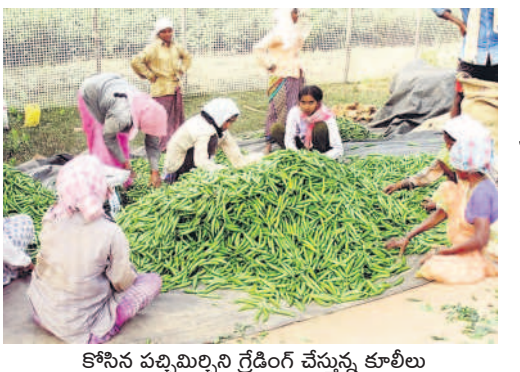
కోసిన పచ్చిమిర్చిని గ్రేడింగ్ చేస్తున్న కూలీలు