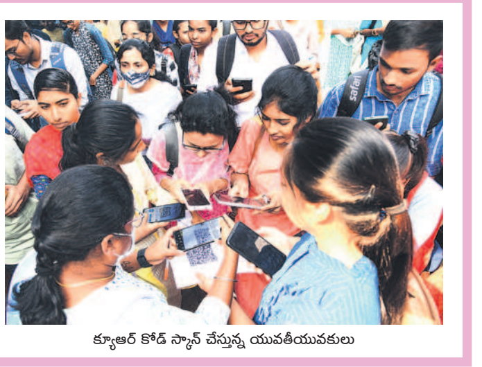
క్యూఆర్ కోడ్ స్కాన్ చేస్తున్న యువతీయువకులు

ప్రస్తుతం పచ్చి, పండు మిర్చికి మార్కెట్ లో మంచి డిమాండ్ ఉంది. తీతో ఇటు పంట సాగు చేసిన రైతులకు నిరులు కురిపిస్తుండగా, కూలీలకూ చేతినిండా పనిదొరుకుతోంది. ఒకప్పుడు పెట్టుబడికి ఇబ్బంది పడే పరిస్థితి ఉండగా ప్రస్తుతం ఆశించిన దిగుబడి వస్తుండడంతో ఇతర ప్రాంతాలకు సైతం ఎగుమతి అవుతోంది. క్వింటాల్ కు రూ.3వేల ధర వలు కుతుండడంతో మిర్చి రైతుల్లో సంతోషం కనిపిస్తోంది. - వాజేడు, డిసెంబర్ 18