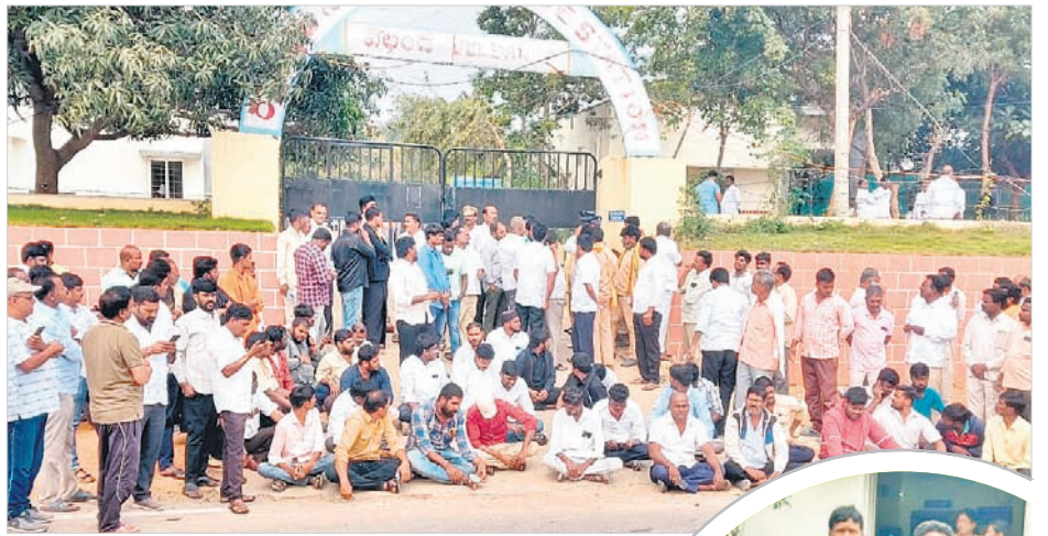
వెల్లండ్ పోలీస్ స్టేషన్ ఎదుట బైరాయిందిన బీఆర్ఎస్ శ్రేణులు

- నాగర్ కర్నూల్ / దేవరకల్ / జడ్చర్ల టౌన్, డిసెంబర్ 18