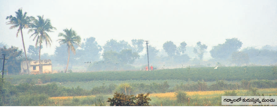
గద్వాలలో కురుస్తున్న మంచు

వేకువజామున మంచు దుప్పటి కప్పకొంటున్నది. పది రోజులుగా ఉష్ణోగ్రతలు కనిష్ట స్థాయికి పడిపోవడంతో మంచు కురుస్తూ చలి పంపిస్తోంది. ఉదయం 9గంటలు దాటినా మంచు కురుస్తూనే ఉండడంతో ప్రకృతి ప్రేమికులను ఆకట్టుకునేలా ఉన్నప్పటికీ వివిధ పనులపై వెళ్లే వారికి మాత్రం కొంత ఇబ్బందులను తెచ్చిపెడుతున్నది. అయినప్పటికీ ఉద్యోగాలకు వెళ్లేవారు, స్కూల్ విద్యార్థులు, పేపర్ బాయిస్, ప్రయాణికులతో పాటు గ్రామీణ ప్రాంతాల్లో రైతులు, గొర్రెలు కాసేవారు తప్పని పరిస్థితుల్లో అలాగే తమ పనులకు వాహనాల్లో వెళ్లే లికి మంచు కారణంగా ఎదురుగా వచ్చే వెహికిల్స్ కనిపించడం లేదు. దీంతో నెమ్మదిగా గమ్యస్థానాలకు చేరుకోవాల్సి వస్తున్నది.