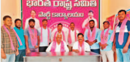
మాట్లాడుతున్న జిఆర్ఎస్ నాయకులు