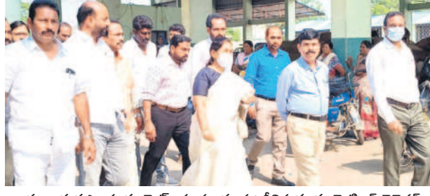
ఖమ్మం వ్యవసాయ మార్కెట్ యార్లూలను పరిశీలిస్తున్న మార్కెటింగ్ డైరెక్టర్

పరిశీలించారు. నిర్మాణాలన్నీ నిబంధనల ప్రకారమే ఉండాలని సూచించారు. అనంతరం పత్తియార్లూరు సందర్భించారు. రైతులు తీసుకోవాల్సిన పత్తింట్లను