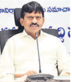
మాట్లాడుతున్న మంత్రి పొంగులేటి

కరుల సమావేశంలో ఆయన మాట్లాడారు. రాష్ట్ర ఆర్థిక పరిస్థితి ఇబ్బందికరంగా ఉన్నప్పటికీ ప్రజా సంక్షేమ పథకాలకు మాత్రం ఆటంకం లేకుండా అమలు చేస్తామని అన్నారు. ఆరు గ్యారంటీల్లో రెండైన మహిళలకు ఆర్డీసీ బస్సులో ప్రయాణం, రాజీవ్ ఆరోగ్య శ్రీ పథకంలో వైద్య ఖర్చుల పరిమితిని రూ.10 లక్షలకు పెంచడం వంటివి అమలు చేస్తున్నామని అన్నారు. ఈ నెల 28 వరకు