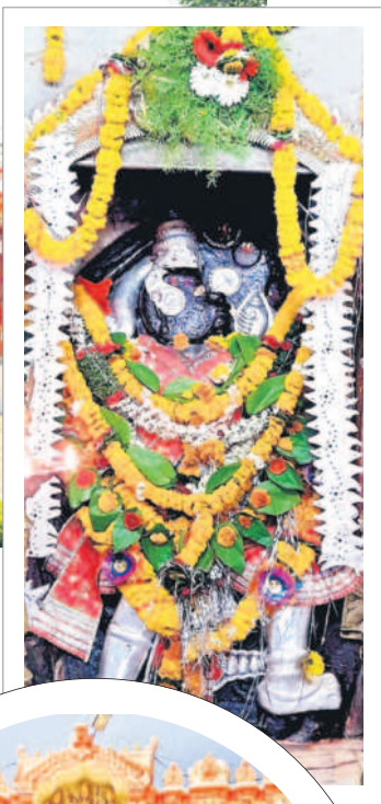
గర్భ గుడిలో మూలవిలాట్