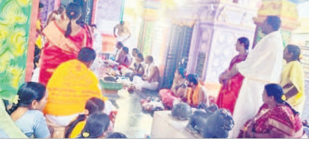
పిట్లంలోని సుబ్రహ్మణ్యస్వామి ఆలయంలో పూజలు చేస్తున్న భక్తులు