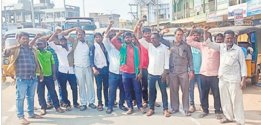
గాంధారిలోని ప్రధాన రహదారిపై నినాదాలు చేస్తున్న ఆటో డ్రైవర్లు