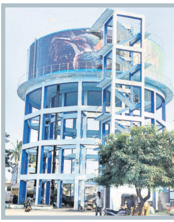
గాంధీ పార్కులో మిషన్ భగీరథ తాగునీరు అందించే ఓవర్ హెడ్ ట్యాంకు

నిర్మల్ అర్బన్, డిసెంబర్ 18 : నిర్మల్ పట్టణవాసులకు నిరంతరం మిషన్ భగీరథ ద్వారా సురక్షితమైన నీరు సరఫరా అవుతోంది. నిర్మల్ జిల్లాలో 692 గ్రామాల పరిధిలోని 5.45 లక్ష మందికి తాగునీటి కోసం ప్రభుత్వం రూ.1,318 కోట్లతో ఇంటికి వెళ్లి, ఫైవలైన్ నిర్మాణాలను పూర్తి చేసి నీరు అందిస్తున్నది. 2008 సంవత్సరంలో నిర్మల్ పట్టణవాసుల దాహార్తిని తీర్చేందుకు అప్పటి ఎమ్మెల్యే అల్లూరి ఇంద్రకాంత్ రూ.32 కోట్లతో తీరాంసాగర్ ప్రాజెక్టు నుంచి నిర్మల్ వరకు ఫైవలైన్ వేయించారు. అనంతరం రూ.39.91 కోట్లతో ఫైవలైన్ పనులను అప్పటి పురపాలక శాఖ మంత్రి కేటీఆర్ తో ప్రారంభించినతరువాత, నిర్మల్ పట్టణంలో 117 కిలోమీటర్ల మిషన్ భగీరథ తాగునీటి ఫైవలైన్ వేయించి 42 వార్డుల ప్రజలకు తాగునీటిని అందిస్తున్నారు.