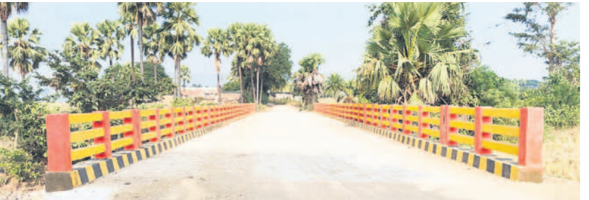
పూర్వం మోకాసిగూడెం వంతెన

దండేపల్లి, డిసెంబర్ 18 : మంచిర్యాల జిల్లా దండేపల్లి మండలంలోని అల్లిపూర్ గ్రామ పంచాయతీ పరిధిలోని మోకాసిగూడెం ఓ మారుమూల గ్రామం. గ్రామానికి ఉన్న వాగుపై వంతెన సౌకర్యం లేక గ్రామస్థులు అవస్థలు పడు తున్నారు. వర్షాకాలం వచ్చేదంటే లో లెవల్ వంతెన మునిగింది. గ్రామస్థులు బిక్కుబిక్కు పోతూ గ్రామంలోనే ఉండాల్సి వచ్చేది. అత్యవసర పరిస్థితుల్లో నాలుగైదు కిలో మీటర్లు తిరిగి లింగాపూర్ మీదుగా ప్రధాన రహదారికి చేరుకోవాలి వచ్చేది. స్వరాష్ట్రం సాధించుకున్నాక గ్రామ స్థుల కల సాకాశమైంది. 2021లో అప్పటి ఎమ్మెల్యే నడి వెల్లి దివాకర్ రావు సూకారంతో వాగుపై వంతెన నిర్మాణానికి కేసీఆర్ ప్రభుత్వం రూ.1.58 కోట్లు మంజూరు చేయడం, వంతెన పనులు చకచకా పూర్తి కావడంతో ఈ యేడాది సెప్టెంబర్ 16న నూతన వంతెనను దివాకర్ రావు దశాబ్దాల కల నేరంది. ఇప్పుడు గ్రామం నుంచి ఇతర గ్రామాలకు వెళ్లాలన్నా, ఐదుంటే గ్రామం ప్రజలకు ఇక్కడికి రావాలన్నా ఇబ్బందులు తొలిగిపోయాయి. మోకాసిగూడెం నుండి కాక అల్లిపూర్, గుడిచేప, లక్ష్మీకాంఠాపూర్ కి కేసీఆర్ ప్రభుత్వం రూ.1.58 కోట్లు మంజూరు చేయడం, వంతెన పనులు చకచకా పూర్తి కావడంతో ఈ యేడాది సెప్టెంబర్ 16న నూతన వంతెనను దివాకర్ రావు