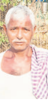
మంచిగా సొలత్ అయింది..

మాజీ మంత్రి అల్లూరి ఇంద్రకాంత్ ప్రత్యేక చొరవతో చేపట్టిన ఈ పనులతో పట్టణ ప్రజలకు రానున్న 30 సంవత్సరాల వరకు ఎలాంటి తాగునీటి ఇబ్బందులు తలెత్తుకుండా చర్యలు చేపట్టారు. పట్టణ ప్రజలకు రెండు ఫైవలైన్ నీరు రానుంది. 2008 సంవత్సరంలో పోషంపాడు నుంచి సిద్ధాపూర్ వరకు వేసిన ఫైవలైన్ మార్గం ద్వారా, మాణింగా నుంచి ఇమరాట్ గట్టు వరకు నీరు రాగా వాటిని ఐదు ఓవర్ హెడ్ ట్యాంకులలో నింపి పట్టణంలోని 207 కిలో మీటర్ల వరకు వేసిన ఫైవలైన్ ద్వారా 20,497 కుటుంబాలకు నీటిని అందిస్తున్నారు. పట్టణ ప్రజలకు తాగునీటిలో ఇబ్బందులు తలెత్తితే తీరాంసాగర్ ప్రాజెక్టు ద్వారా తాగునీటిని అందించేందుకు ముందుగా చర్యలు చేపట్టారు.