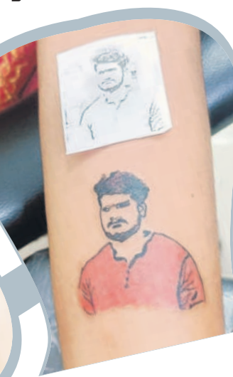
వెరైటీ డిజైన్లతో టాటూ