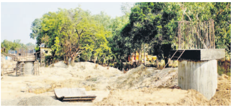
కొనసాగుతున్న రైల్వే వంతెన పనులు