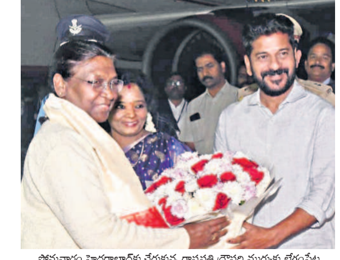
సోమవారం హైదరాబాద్ కు చేరుకున్న రాష్ట్రపతి ద్రౌపది ముర్ముకు జేగంపేట బిమానాశ్రయంలో స్వాగతం పలుకుతున్న సీఎం రేవంత్, గవర్నర్ తమిళిస్సె

రాష్ట్రాలు, యూటీలకు కేంద్రం లేబుల ప్రభుత్వం అన్ని రాష్ట్రాలు, యూటీలకు సోమవారం లేబు రాసింది. కేసుల పెరుగుదల, జేఎన్.1 వేరియంట్