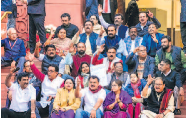
తమను సస్పెండ్ చేయడాన్ని నిరసనగా సోమవారం లోక్ సభ ప్రధాన ద్వారం వద్ద భైరాయిని నిరసన తెలుపుతున్న ప్రతిపక్ష పార్టీల ఎంపీలు

గుట్టుచప్పుడు కాకుండా నిర్మాణం ముమ్మరం పోతిరెడ్డిపాడు హెడ్ రెగ్యులేటర్ విస్తరణ కూడా.. తెలంగాణలో ఎన్నికల అదనుగా తంపులాటకు.. మరోవైపు సాగర్ డ్యామ్ కుడికాలువ ఆక్రమణ ఇప్పటికీ ఆంధ్రప్రదేశ్ ఆధీనంలోనే లిఫ్ట్ కెనాల్ > 2వ పేజీలో