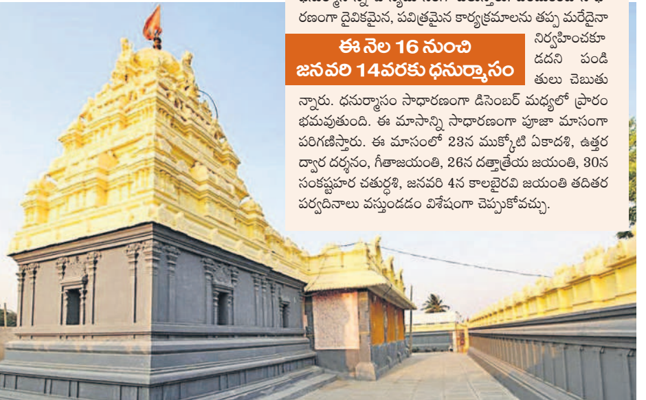
అద్వైత్ గ్రామంలోని రామాలయం

ఈ నెల 16న అర్ధరాత్రి ధనుర్మాసం ప్రారంభమై 2024 జనవరి 14 ముగిసాయి. అంటే మకర సంక్రాంతికి ముగిస్తుంది. ధనుర్మాసాన్ని శూన్యమాసంగా పిలుస్తారు. ఎందుకంటే సాధారణంగా దైవికమైన, పవిత్రమైన కార్యక్రమాలను తప్ప మరేదైనా నిర్వహించకూడదని పండితులు చెబుతున్నారు. ధనుర్మాసం సాధారణంగా డిసెంబర్ మధ్యలో ప్రారంభమవుతుంది. ఈ మాసాన్ని సాధారణంగా పూజా మాసంగా పరిగణిస్తారు. ఈ మాసంలో 23న ముక్కోటి ఏకాదశి, ఉత్తర ద్వార దర్శనం, గీతాజయంతి, 26న దత్తాత్రేయ జయంతి, 30న సంకష్టహర చతుర్దశి, జనవరి 4న కాలభైరవి జయంతి తదితర పర్వదినాలు వస్తుండడం విశేషంగా చెప్పుకోవచ్చు.