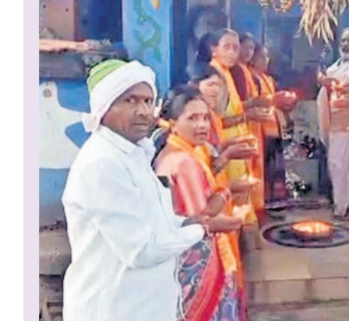
బైరాన్పల్లి అంజనేయస్వామి ఆలయంలో భగవన్నామస్మరణ చేస్తున్న భక్తులు

ధనుర్మాసంలో ఈ నెలలకు మాత్రమే ఎక్కువ ప్రాధాన్యం ఉందని చాలా మంది భావిస్తారు. కానీ, ధనుర్మాసం కూడా చాలా ఆధ్యాత్మిక ప్రయోజనాలు కలిగిన నెల అని చాలా మందికి తెలియదు. ఈ నెలకు కూడా చాలా ప్రత్యేకత ఉంది. ధనుర్మాసమంతా.. ఉదయం నాయంత్రం ఇల్లు శుభ్రం చేసి.. దీపారాధన చేయడం వల్ల మహాలక్ష్మి కరుణ, కల్యాణాలు సిద్ధమవుతాయి. ధనుర్మాసం విష్ణువుకి చాలా ప్రత్యేకమైనది. తిరుమలలో ఈ ధనుర్మాసం రోజుల్లో సుప్రభాతం బదులు తిరుప్పావై గానం చేస్తారు. విష్ణువు ఆలయాల్లో ఉదయం అర్చనలు చేసి నివేదనలు చేసి వాటిని పిల్లలకు పంచుతారు. ఇలా చేయడాన్ని బాలభోగం అంటారు. ధనుర్మాసం దేవతలకి బ్రహ్మీ ముహూర్తం లాంటిది. ఈ మకర, కర్కాటక సంక్రాంతలలో స్నాన, దాన, హోమ, ప్రత పూజలు చేయడం చాలా మంచిది.