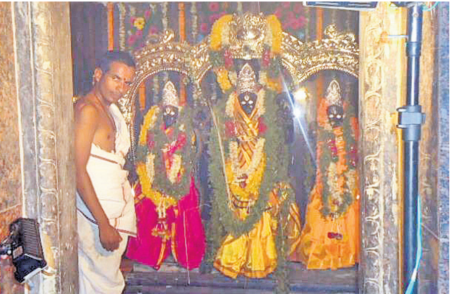
అద్వైత్లో కొలువుదీరిన సీతారామచంద్ర, లక్ష్మణమూర్తులు