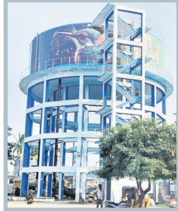
గాంధీ పార్కులో మిషన్ భగీరథ తాగునీరు అందించే ఓవర్ హెడ్ ట్యాంకు