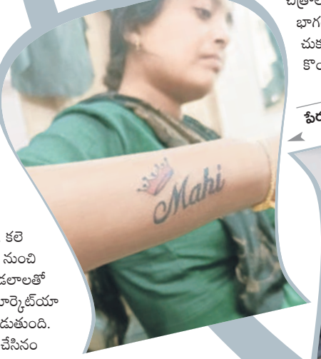
పేరు టాటూ వేసుకున్న యువతులు

ప్రస్తుతం మార్కెట్లో నార్మల్, పర్సినెంట్, సెమ్ పర్సినెంట్ డిజైన్లు అందుబాటులోకి వచ్చాయి. గతంలో వృద్ధుల చేతులపై పచ్చబొట్టు మాత్రమే కనిపించేవి. కానీ ప్రస్తుతం మల్టి కలర్స్ తో లైఫ్ టైం ఉండేలా టాటూలు అందుబాటులోకి రావడం గమనార్హం.