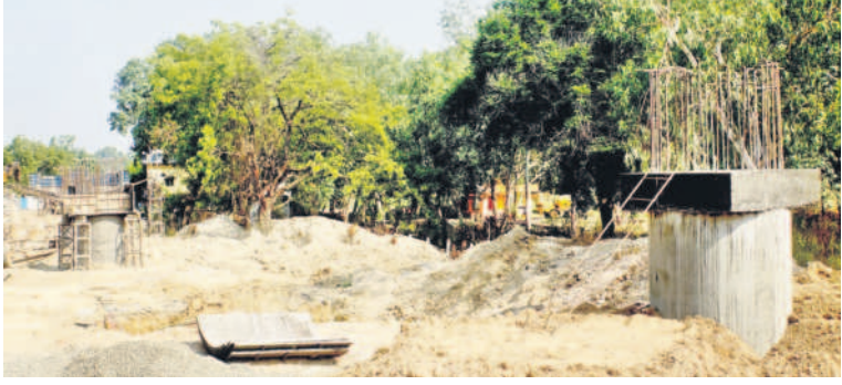
కొనసాగుతున్న రైల్వే వంతెన పనులు