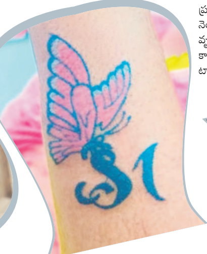
వెరైటీ డిజైన్లతో టాటూ