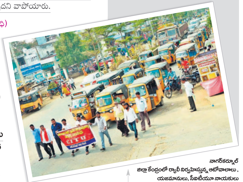
నాగర్ కర్నూల్ జిల్లా కేంద్రంలో ర్యాలీ నిర్వహిస్తున్న ఆటోవాలాలు. యజమానులు, సీబీయూ నాయకులు