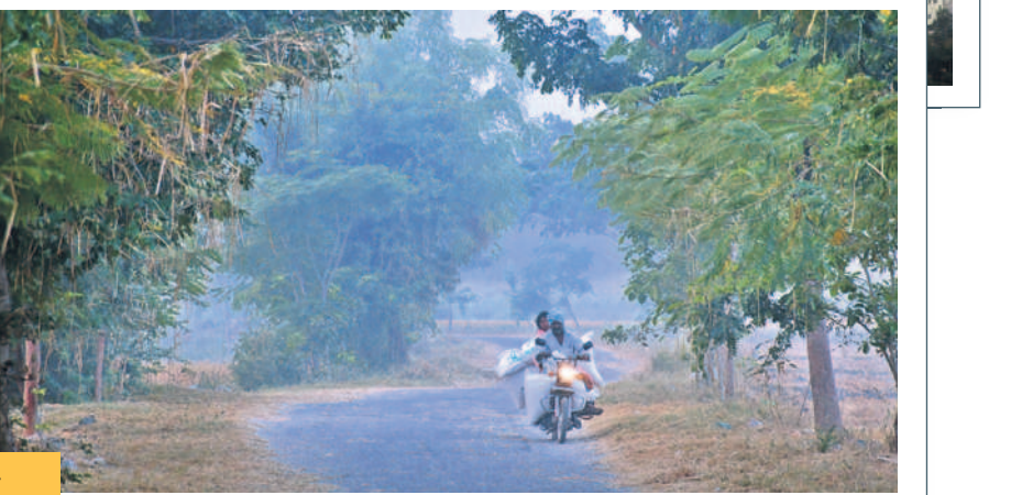
మంచుదుప్పటి కొమ్ముకొన్న మహబూబ్ నగర్ పట్టణం