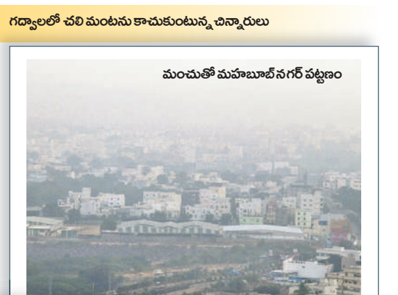
మంచుతో మహబూబ్ నగర్ పట్టణం