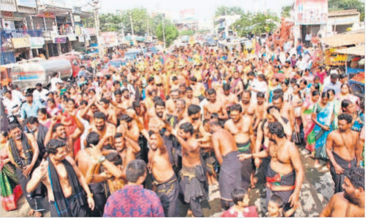
కలశాలు, కావడితో ఊరేగింపు నిర్వహిస్తున్న అయ్యప్పస్వాములు

■ నామస్వరణతో మార్చి గిన కొత్తకోట ■ 108 కలశాలతో ఊరేగింపు