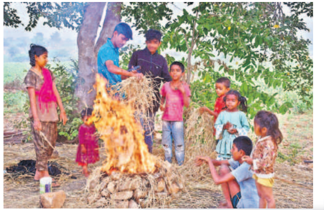
గద్వాలలో చలి మంటను కాచుకుంటున్న చిన్నారులు

వేకువజామున మంచు దుప్పటి కప్పకొంటున్నది. పది రోజులుగా ఉష్ణోగ్రతలు కనిష్ట స్థాయికి పడిపోవడంతో మంచు కురుస్తూ చలి పంపిస్తోంది. ఉదయం 9గంటలు దాటినా మంచు కురుస్తూనే ఉండడంతో ప్రకృతి ప్రేమికులను ఆకట్టుకునేలా ఉన్నప్పటికీ వివిధ పనులపై వెళ్లే వారికి మాత్రం కొంత ఇబ్బందులను తెచ్చిపెడుతున్నది. అయినప్పటికీ ఉద్యోగాలకు వెళ్లేవారు, స్కూల్ విద్యార్థులు, పేపర్ బాయిస్, ప్రయాణికులతో పాటు గ్రామీణ ప్రాంతాల్లో రైతులు, గొర్రెలు కాసేవారు తప్పని పరిస్థితుల్లో అలాగే తమ పనులకు వాహనాల్లో వెళ్లే లికి మంచు కారణంగా ఎదురుగా వచ్చే వెహికిల్స్ కనిపించడం లేదు. దీంతో నెమ్మదిగా గమ్యస్థానాలకు చేరుకోవాల్సి వస్తున్నది.