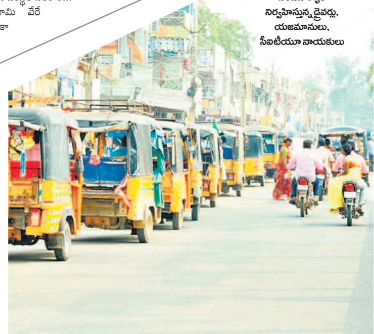
నాగర్ కర్నూల్ జిల్లా కేంద్రంలో ఆటోలతో నిరసన ర్యాలీ నిర్వహిస్తున్న రైతులు, యజమానులు, సీబీటీయూ నాయకులు