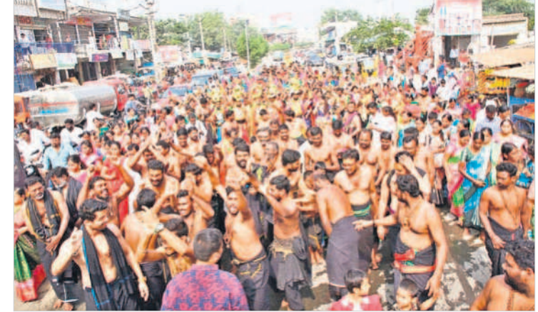
కలశాలు, కావడితో ఊరేగింపు నిర్వహిస్తున్న అయ్యప్పస్వాములు

■ నామస్కరణతో మార్చి గిన కొత్తకోట ■ 108 కలశాలతో ఊరేగింపు