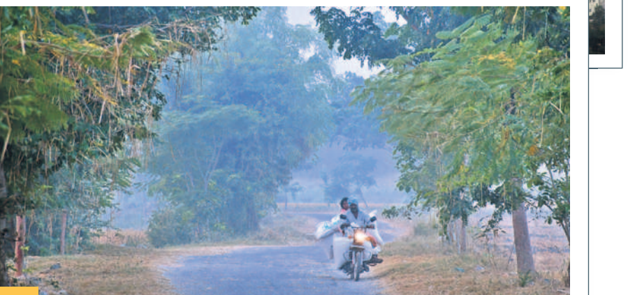
మంచుదుప్పటి కొమ్ముకొన్న మహబూబ్ నగర్ పట్టణం