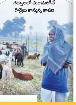
గద్వాలలో మంచులోనే గొర్రెలు కాస్తున్న కావలి