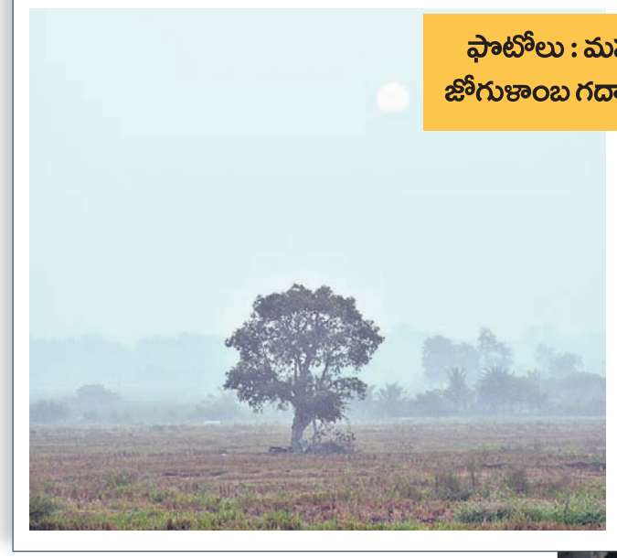
గద్వాల శివారులో మంచుతో కమ్ముకొన్న పొలాలు