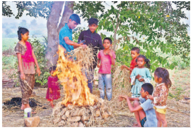
గద్వాలలో చలి మంటను కాచుకుంటున్న చిన్నారులు

వేకువజామున మంచు దుప్పటి కప్పకొంటున్నది. పది రోజులుగా ఉష్ణోగ్రతలు కనిష్ట స్థాయికి పడిపోవడంతో మంచు కురుస్తూ చలి పంపిస్తోంది. ఉదయం 9గంటలు దాటినా మంచు కురుస్తూనే ఉండడంతో ప్రకృతి ప్రేమికులను ఆకట్టుకునేలా ఉన్నప్పటికీ వివిధ పనులపై వెళ్లే వారికి మాత్రం కొంత ఇబ్బందులను తెచ్చిపెడుతున్నది. అయినప్పటికీ ఉద్యోగాలకు వెళ్లేవారు, స్కూల్ విద్యార్థులు, పేపర్ బాయిస్, ప్రయాణికులతో పాటు గ్రామీణ ప్రాంతాల్లో రైతులు, గొర్రెలు కాసేవారు తప్పని పరిస్థితుల్లో అలాగే తమ పనులకు వాహనాల్లో వెళ్లే లికి మంచు కారణంగా ఎదురుగా వచ్చే వెహికిల్స్ కనిపించడం లేదు. దీంతో నెమ్మదిగా గమ్యస్థానాలకు చేరుకోవాల్సి వస్తున్నది.