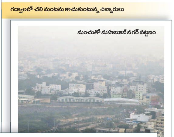
మంచుతో మహబూబ్ నగర్ పట్టణం