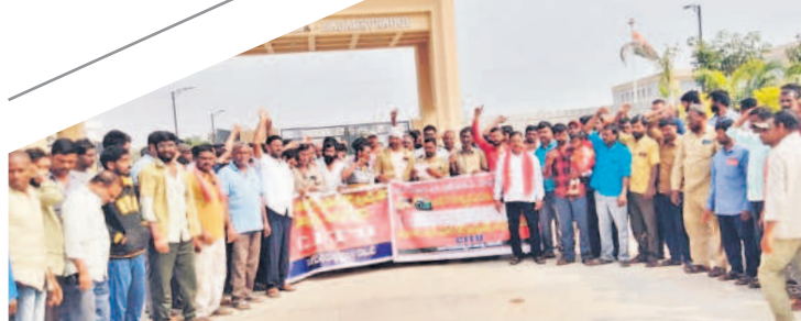
నాగర్ కర్నూల్ కలెక్టరేట్ ఎదుట నిరసన తెలుపుతున్న రైతులు, యజమానులు

మహబూబ్ నగర్, డిసెంబర్ 18 (నమస్తే తెలంగాణ ప్రతినిధి) : సాగుకు సాయంగా రైతుబంధు పడుతుందని ఆశతో ఉన్న రైతాంగానికి రేవంత్ సర్కార్ రులకిస్తోంది. యాసంగి సాగుకు కేసీఆర్ సర్కార్ ఇచ్చినట్లే రైతుబంధు జమ చేస్తామని ప్రకటించి ఆరు రోజులైనా ఇంకా రైతుల ఖాతాల్లోకి టింగ్.. టింగ్మంటూ మెసేజ్లు రావడం లేదు. ఐదెకరాలలోపు రైతాంగానికి ఇవ్వాలని ఆదేశించినప్పటికీ అకౌంట్ రైతుబంధు పడుతోంది. మహబూబ్ నగర్ జిల్లాలో ఓ రైతుకు రైతుబంధు ఒక్క రూపాయి పడడం ఆశ్చర్యం కలిగిస్తోంది. ఏ లెక్కలో ఒక్క రూపాయి వేకాలో అర్థం కావడం లేదని ఆ రైతు వాపోతున్నాడు. మరికొంత మందికి రూ.100లోపే రైతుబంధు డబ్బులు పడడం విస్మయం కలిగిస్తున్నది. దీంతో రైతుల ఆశలు నీరుగారుతున్నాయి. ఎకరాకు రూ.15వేలు ఇస్తామని గొప్పలు చెప్పిన కాంగ్రెస్ ఇప్పుడు ముఖం చాటిస్తున్నదని ప్రకృతులు విమర్శిస్తున్నారు. యాసంగి సాగు దగ్గర పడుతున్న కొద్దీ రైతుబంధుపై ఆశ పెట్టుకున్న వేలాది మంది రైతుల్లో గుబులు రేగుతోంది. ఇక ఆపు తప్పదేమోనని ఆందోళన చెందుతున్నారు. మహబూబ్ నగర్ జిల్లాలో ఇప్పటి వరకు 55,184 మందికి రూ.11.98కోట్లు, నారాయణ పేట జిల్లాలో 27వేల మందికి రూ.5 కోట్ల 75 లక్షలు, గద్వాల జిల్లాలో 20,229 మందికి రూ.4కోట్ల 59లక్షల 8,979,