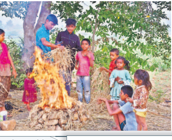
గద్వాలలో చలి మంటను కాచుకుంటున్న చిన్నారులు

వేకువజామున మంచు దుప్పటి కప్పకొంటున్నది. పది రోజులుగా ఉష్ణోగ్రతలు కనిష్ట స్థాయికి పడిపోవడంతో మంచు కురుస్తూ చలి పంపేస్తోంది. ఉదయం 9గంటలు దాటితే మంచు కురుస్తూనే ఉండడంతో ప్రకృతి ప్రేమికులను ఆకట్టుకునేలా ఉన్నప్పటికీ వివిధ పనులపై వెళ్లే వారికి మాత్రం కొంత ఇబ్బందులను తెచ్చిపెడుతున్నది. అయినప్పటికీ ఉద్యోగాలకు వెళ్లేవారు, స్కూల్ విద్యార్థులు, పేపర్ బాయిస్, ప్రయాణికులతో పాటు గ్రామీణ ప్రాంతాల్లో రైతులు, గొర్రెలు కాసేవారు తప్పని పరిస్థితుల్లో అలాగే తమ పనులకు వాహనాల్లో వెళ్లే లికి మంచు కారణంగా ఎదురుగా వచ్చే వెహికిల్స్ కనిపించడం లేదు. దీంతో నెమ్మదిగా గమ్యస్థానాలకు చేరుకోవాల్సి వస్తున్నది.