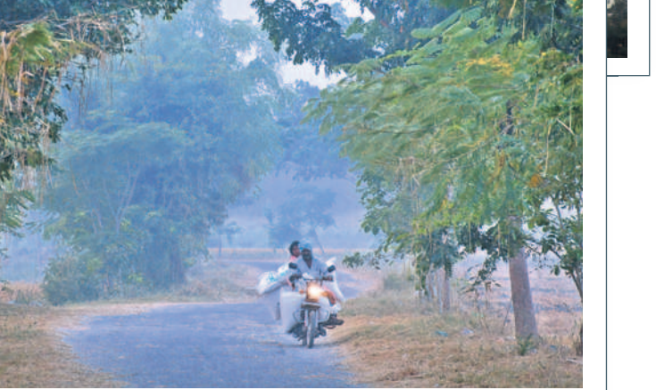
మంచుదప్పటి కొమ్మకొన్న మహబూబ్ నగర్ పట్టణం