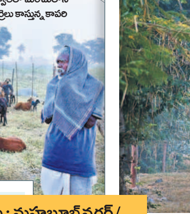
గద్వాలలో మంచులోనే గొర్రెలు కాస్తున్న కావలి