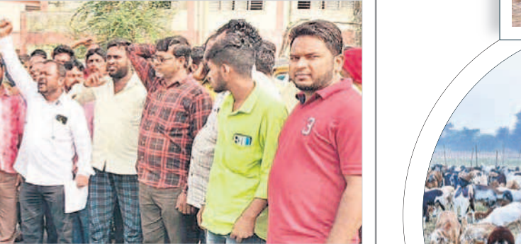
జడ్పీలోని అంబేద్కర్ చారిత్రాత్మక నిరసన తెలుపుతున్న ఆటో డ్రైవర్లు