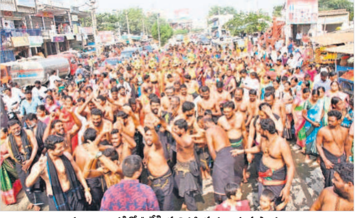
కలశాలు, కావడితో ఉరేగింపు నిర్వహిస్తున్న అయ్యప్పస్వాములు

■ నామస్వరణతో మార్చి గిన కొత్తకోట ■ 108 కలశాలతో ఉరేగింపు