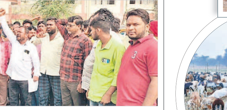
జడ్పీలోని అంబేద్కర్ చారిత్రాత్మక నిరసన తెలుపుతున్న ఆటో డ్రైవర్లు