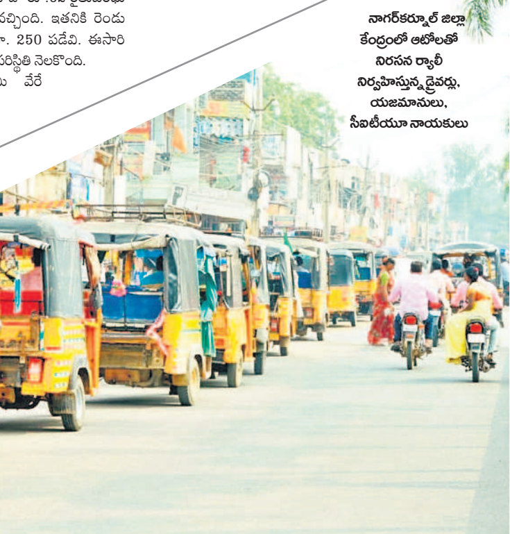
నాగర్ కర్నూల్ జిల్లా కేంద్రంలో ఆటోలతో నిరసన రా్యి నిర్వహిస్తున్న డైవర్లు, యజమానులు, సీబిటియూ నాయకులు

అప్పులు తప్పేలా లేవు.. యాసంగి సాగుకు రైతులు సిద్ధమవుతున్నారు. గత నెలలోనే కేసీఆర్ సర్కారు జమచేస్తామంటే కాంగ్రెస్ నాయకులు ఎన్నికలకు ముందు చేయొద్దని ఈసీకి ఫిర్యాదు చేశారు. పోలింగ్ రెండు రోజులు ఉండగా ఈసీ రైతుబంధుకు అనుమతి ఇవ్వగా, మళ్ళీ అడ్డుకోవడంతో రైతుల ఖాతాల్లో జమ కాలేదు. కొత్త సర్కార్ వచ్చాక రైతులు రైతుబంధుపై ఆశలు పెట్టుకున్నారు. కాంగ్రెస్ అధికారంలోకి వస్తే రూ.15వేలు జమ అవుతుంది గోవులు చెప్పిన రేవంత్ సర్కార్ వివేకానికి పాత పద్ధతినే ఇచ్చేందుకు మొగ్గుచూపారు. ఇచ్చే డబ్బులు ఇప్పటికీ రాకపోవడంతో రైతుల్లో ఆందోళన నెలకొంది.