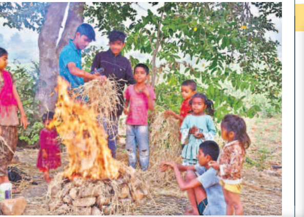
గద్వాలలో చలి మంటను కాచుకుంటున్న చిన్నారులు

వేకువజామున మంచు దుప్పటి కప్పకొంటున్నది. పది రోజులుగా ఉష్ణోగ్రతలు కనిష్ట స్థాయికి పడిపోవడంతో మంచు కురుస్తూ చలి పంపేస్తోంది. ఉదయం 9గంటలు దాటితే మంచు కురుస్తూనే ఉండడంతో ప్రకృతి ప్రేమికులను ఆకట్టుకునేలా ఉన్నప్పటికీ వివిధ పనులపై వెళ్లే వారికి మాత్రం కొంత ఇబ్బందులను తెచ్చిపెడుతున్నది. అయినప్పటికీ ఉద్యోగాలకు వెళ్లేవారు, స్కూల్ విద్యార్థులు, పేపర్ బాయిస్, ప్రయాణికులతో పాటు గ్రామీణ ప్రాంతాల్లో రైతులు, గొర్రెలు కాసేవారు తప్పని పరిస్థితుల్లో అలాగే తమ పనులకు వాహనాల్లో వెళ్లే లికి మంచు కారణంగా ఎదురుగా వచ్చే వెహికిల్స్ కనిపించడం లేదు. దీంతో నెమ్మదిగా గమ్యస్థానాలకు చేరుకోవాల్సి వస్తున్నది.