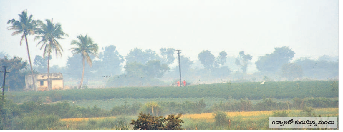
గద్వాలలో కురుస్తున్న మంచు

వేకువజామున మంచు దుప్పటి కప్పకొంటున్నది. పది రోజులుగా ఉష్ణోగ్రతలు కనిష్ట స్థాయికి పడిపోవడంతో మంచు కురుస్తూ చలి పంపేస్తోంది. ఉదయం 9గంటలు దాటితే మంచు కురుస్తూనే ఉండడంతో ప్రకృతి ప్రేమికులను ఆకట్టుకునేలా ఉన్నప్పటికీ వివిధ పనులపై వెళ్లే వారికి మాత్రం కొంత ఇబ్బందులను తెచ్చిపెడుతున్నది. అయినప్పటికీ ఉద్యోగాలకు వెళ్లేవారు, స్కూల్ విద్యార్థులు, పేపర్ బాయిస్, ప్రయాణికులతో పాటు గ్రామీణ ప్రాంతాల్లో రైతులు, గొర్రెలు కాసేవారు తప్పని పరిస్థితుల్లో అలాగే తమ పనులకు వాహనాల్లో వెళ్లే లికి మంచు కారణంగా ఎదురుగా వచ్చే వెహికిల్స్ కనిపించడం లేదు. దీంతో నెమ్మదిగా గమ్యస్థానాలకు చేరుకోవాల్సి వస్తున్నది.