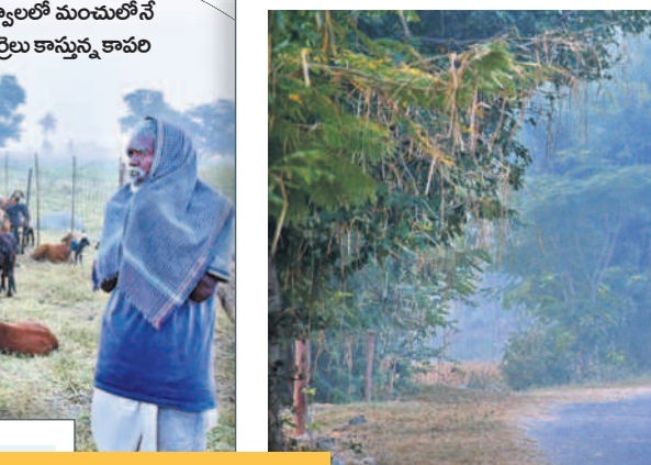
గద్వాలలో మంచులోనే గొర్రెలు కాస్తున్న కావలి