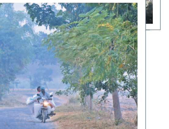
మంచుదుప్పటి కొమ్ముకొన్న మహబూబ్ నగర్ పట్టణం