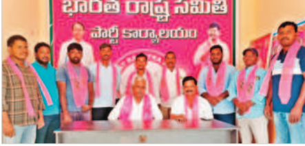
మాట్లాడుతున్న జిఆర్ఎస్ నాయకులు