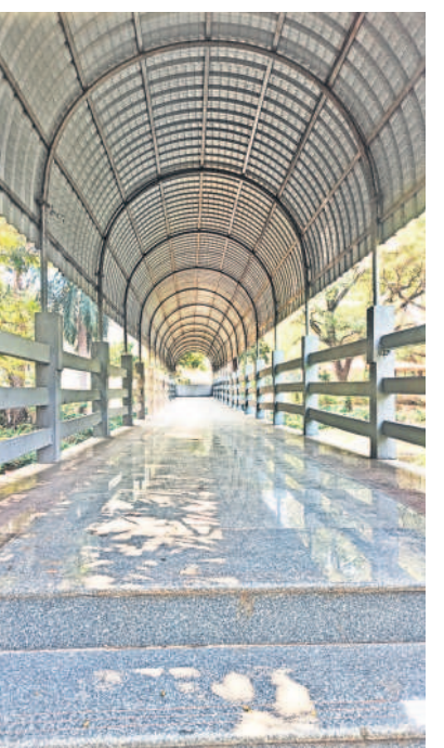
గార్డెన్ లో పులి ఓవర్ బ్రిడ్జి

ములుగు జిల్లా వాజేడు మండలంలోని పలు గ్రామాల్లో రైతులు ఎక్కువగా మిర్చి సాగు చేశారు. ఇందులో 341, ఇండికా, వండర్ హోట్ తదితర రకాల పచ్చిమిర్చి, పండు మిర్చి ఉన్నాయి. ఇందులో కాతక వచ్చిన పచ్చి మిర్చి, పండు మిర్చికి మార్కెట్ లో మంచి డిమాండ్ ఉంది. బయట మార్కెట్ కు ఎగుమతులు చేస్తూ ఆశించిన లాభాలు గడిస్తున్నారు. మిర్చి సాగుకు ఎకరూ రూ.2లక్షలపైనే ఖర్చు అవుతుండగా గతంలో రైతులు పెట్టుబడులకు ఇబ్బంది పడేవారు. కానీ ఇప్పుడు మిర్చి పంట వేసిన మూడు నెలల్లో పచ్చి మిర్చి కోతకు సిద్ధంగా ఉండడంతో రైతులు కూలీల సహాయంతో పచ్చి మిర్చిని కోయించి వాటిని ప్రత్యేకంగా గ్రేడింగ్ చేయించి తూకం వేసి సంచుల్లో నింపి అమ్ముతున్నారు. క్వింటా పచ్చి మిర్చికి మార్కెట్ లో రూ.2800, పండు మిర్చి రూ.3వేల వరకు ధర పలుకుతోంది. దీంతో చిన్న, సన్నకారు రైతులు పచ్చిమిర్చిని చేను వద్దకు వచ్చే వ్యాపారులకు విక్రయించి పంటను సాగుచేసుకుంటున్నారు. దీని వల్ల తమకు బయట పెట్టుబడి తిచ్చే బాధ కొంత మేర తగ్గిందని చెబుతున్నారు. అమ్మిన మిర్చి డబ్బులతో పంటకు పెట్టుబడి సొంతంగా పెట్టుకుంటున్నామని రైతులు పేర్కొంటున్నారు. విడి వేలూ పచ్చి మిర్చి, పండు మిర్చి అమ్మకాల వల్ల రైతులకు చేతికి సగం అందుతుండడంతో గోలు చేసి హైడ్రోలాజిక్, వరంగల్, నర్సంపేట పచ్చిమిర్చి కోతలు మొదలవుతున్నాయి. పచ్చి, పండు మిర్చికోత కోసే కూలీలకు సైతం చేతినిండా పని దొరుకుతుండడంతో వారు సైతం సంతోషం వ్యక్తం చేస్తున్నారు.