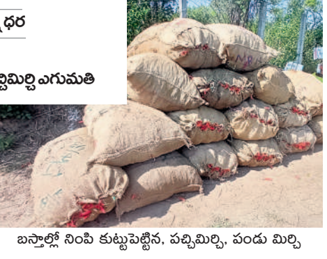
బస్తాల్లో నింపి కుట్టుపెట్టిన, పచ్చిమిర్చి, పండు మిర్చి

లాభసాటిగా ఉంది.. పచ్చి, పండు మిర్చి అమ్మడం వల్ల కొంత మేర పెట్టుబడి ఖర్చు తగ్గుతుంది. పచ్చిమిర్చి అమ్మడం మాకు లాభసాటిగా ఉంది. లాభంగా కాసిన పచ్చిమిర్చికి మార్కెట్ లో ధర బాగానే పలుకుతోంది. పచ్చి మిర్చి, పండు మిర్చి అమ్మకాల వల్ల మాతో పాటు కూలీలకు సైతం చేతినిండా పనిదొరుకుతోంది.