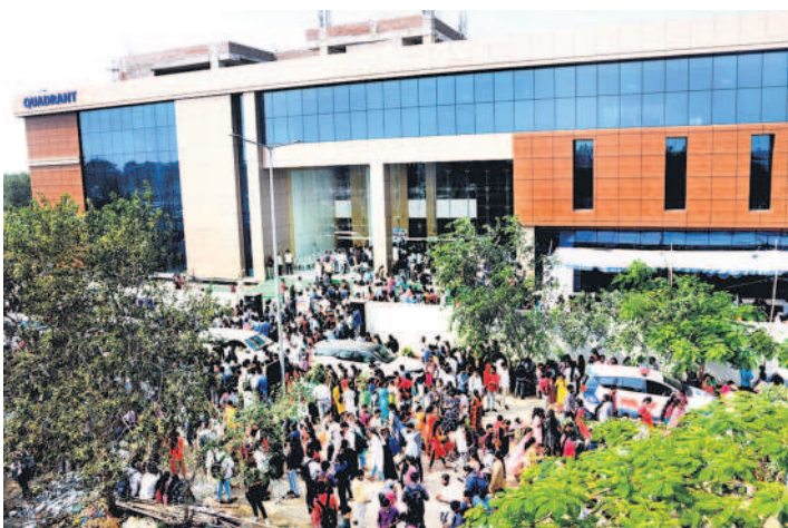
ఉద్యోగార్థులతో క్యాంపస్ కంపెనీ వద్ద కోలాహలం