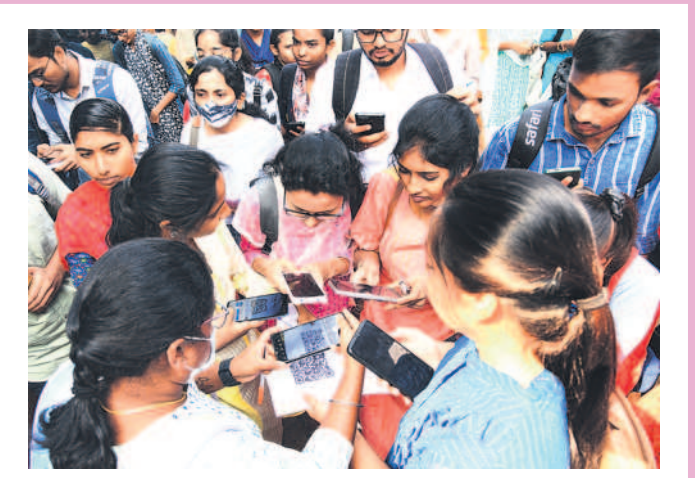
క్యూఆర్ కోడ్ స్కాన్ చేస్తున్న యువతీయువకులు

ప్రస్తుతం పచ్చి, పండు మిర్చికి మార్కెట్ లో మంచి డిమాండ్ ఉంది. తీతో ఇటు పంట సాగు చేసిన రైతులకు నిరులు కురిపిస్తుండగా, కూలీలకూ చేతినిండా పనిదొరుకుతోంది. ఒకప్పుడు పెట్టుబడికి ఇబ్బంది పడే పలసిత్తి ఉండగా ప్రస్తుతం ఆశించిన దిగుబడి వస్తుండడంతో ఇతర ప్రాంతాలకు సైతం ఎగుమతి అవుతోంది. క్వింటాల్ కు రూ.3వేల ధర పలు కుతుండడంతో మిర్చి రైతుల్లో సంతోషం కనిపిస్తోంది. - వాజేడు, డిసెంబర్ 18