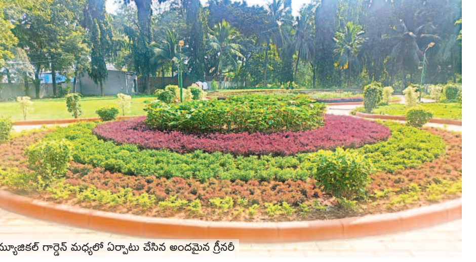
మ్యూజికల్ గార్డెన్ మధ్యలో ఏర్పాటు చేసిన అందమైన గ్రీనరీ

తుది దశకు అభివృద్ధి పనులు కాకతీయ మ్యూజికల్ గార్డెన్ అభివృద్ధి పనులు చివరి దశకు చేరుకున్నాయి. మ్యూజికల్ గార్డెన్ లో ముందుభాగంలో గ్రీనరీ పనులు దాదాపుగా పూర్తిచేశారు. బిన్యూరుల కోసం ఆట వస్తువులను ఏర్పాటుచేశారు. పులిపాతలను ట్రైల్స్ తో అందంగా తీర్చిదిద్దారు. మ్యూజికల్ గార్డెన్ లోని రెండు ట్రిడ్డిలకు అందగా ముస్తాయి చేశారు. గతంలో ట్రిడ్డిలకు పైకప్పు ఉండేది కాదు. పునరుద్ధరణలో బాగాగా ఇప్పుడు ట్రిడ్డిలకు పైకప్పులతో పాటు గ్రానైట్ ట్రైల్స్ చేశారు. దీంతో ట్రిడ్డిలు అందంగా కనిపిస్తున్నాయి.