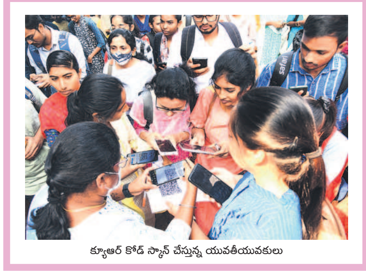
క్యాంపస్ కోడ్ స్కాన్ చేస్తున్న యువతీయువకులు

ప్రస్తుతం పచ్చి, పండు మిర్చికి మార్కెట్ లో మంచి డిమాండ్ ఉంది. తీతో ఇటు పంట సాగు చేసిన రైతులకు నిరులు కురిపిస్తుండగా, కూలీలకూ చేతినిండా పనిదొరుకుతోంది. ఒకప్పుడు పెట్టుబడికి ఇబ్బంది పడే పరిస్థితి ఉండగా ప్రస్తుతం ఆశించిన దిగుబడి వస్తుండడంతో ఇతర ప్రాంతాలకు సైతం ఎగుమతి అవుతోంది. క్వింటాల్ కు రూ.3వేల ధర వలు కుతుండడంతో మిర్చి రైతుల్లో సంతోషం కనిపిస్తోంది. - వాజేడు, డిసెంబర్ 18