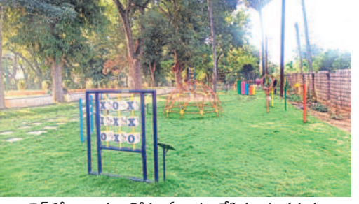
గార్డెన్ లో బిన్నారల కోసం ఏర్పాటు చేసిన ఆట వస్తువులు

వరంగల్ లోని కాకతీయ మ్యూజికల్ గార్డెన్ పునరుద్ధరణ పనుల్లో వేగం పుంజుకుంది. దాదాపు 90శాతం పూర్వవధంతో త్వరలో ప్రారంభించేందుకు అధికార యంత్రాంగం సన్నాహాలు చేస్తోంది. రూ.కోటి 60 లక్షల కూడా నిడులతో గార్డెన్ పనులు చేపట్టగా పూర్వవైభవం సంతరించుకొని చూడ చక్కని అందాలతో ఆకట్టుకోనున్నది. - వరంగల్, డిసెంబర్ 18