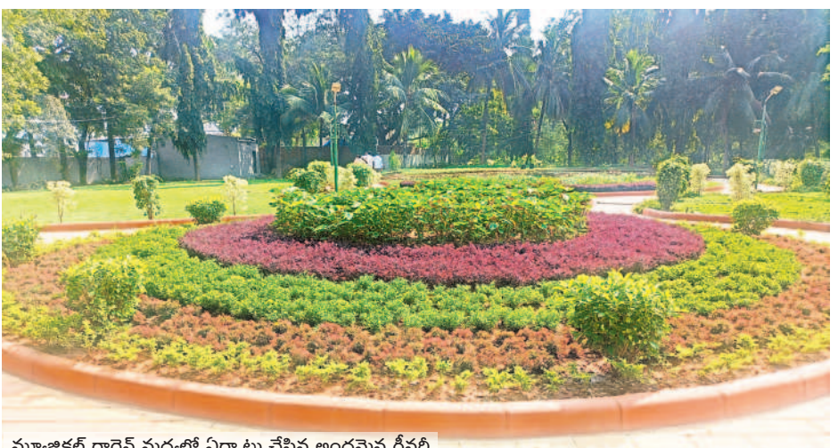
మ్యూజికల్ గార్డెన్ మధ్యలో ఏర్పాటు చేసిన అందమైన గ్రీనరీ

తుది దశకు అభివృద్ధి పనులు కాకతీయ మ్యూజికల్ గార్డెన్ అభివృద్ధి పనులు చివరి దశకు చేరుకున్నాయి. మ్యూజికల్ గార్డెన్ లో ముందుభాగంలో గ్రీనరీ పనులు దాదాపుగా పూర్తిచేశారు. చిన్నారల కోసం ఆట వస్తువులను ఏర్పాటుచేశారు. పుట్టెత్తలను ట్రైల్స్ తో అందంగా తీర్చిదిద్దారు. మ్యూజికల్ గార్డెన్ లోని రెండు ట్రిడ్డిలకు అందగా ముస్తాయి చేశారు. గతంలో ట్రిడ్డిలకు పైకప్పు ఉండేది కాదు. పునరుద్ధరణలో బాగాగా ఇప్పుడు ట్రిడ్డిలకు పైకప్పులతో పాటు గ్రాస్ బ్లెడ్స్ చేశారు. దీంతో ట్రిడ్డిలు అందంగా కనిపిస్తున్నాయి.