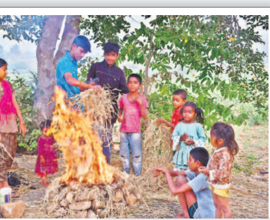
గద్వాలలో చలి మంటను కాచుకుంటున్న చిన్నారులు

వేకువజామున మంచు దుప్పటి కప్పకొంటున్నది. పది రోజులుగా ఉష్ణోగ్రతలు కనిష్ట స్థాయికి పడిపోవడంతో మంచు కురుస్తూ చలి పంపేస్తోంది. ఉదయం 9గంటలు దాటినా మంచు కురుస్తూనే ఉండడంతో ప్రకృతి ప్రేమికులను ఆకట్టుకునేలా ఉన్నప్పటికీ వివిధ పనులపై వెళ్లే వారికి మాత్రం కొంత ఇబ్బందులను తెచ్చిపెడుతున్నది. అయినప్పటికీ ఉద్యోగాలకు వెళ్లేవారు, స్కూల్ విద్యార్థులు, పేపర్ బాయిస్, ప్రయాణికులతో పాటు గ్రామీణ ప్రాంతాల్లో రైతులు, గొర్రెలు కాసేవారు తప్పని పరిస్థితుల్లో అలాగే తమ పనులకు వాహనాల్లో వెళ్లే లికి మంచు కారణంగా ఎదురుగా వచ్చే వెహికిల్స్ కనిపించడం లేదు. దీంతో నెమ్మదిగా గమ్యస్థానాలకు చేరుకోవాల్సి వస్తున్నది.