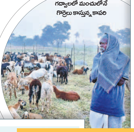
గద్వాలలో మంచులోనే గొర్రెలు కాస్తున్న కావలి