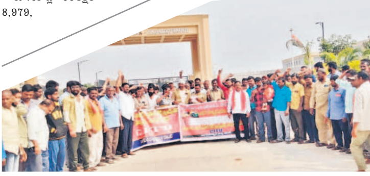
నాగర్ కర్నూల్ కలెక్టరేట్ ఎదుట నిరసన తెలుపుతున్న డ్రైవర్లు, యజమానులు