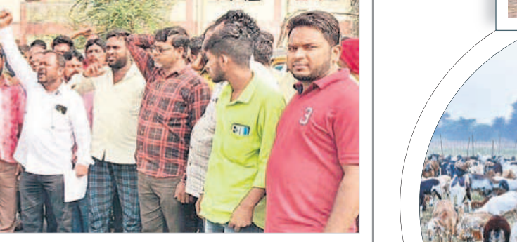
జడ్పీలోని అంబేద్కర్ చారిత్రాత్మక నిరసన తెలుపుతున్న ఆటో డ్రైవర్లు