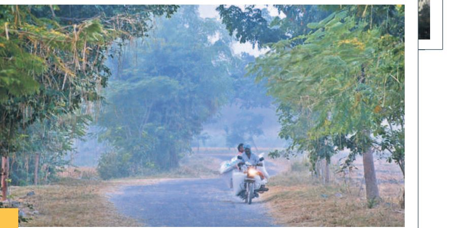
మంచుదుప్పటి కొమ్ముకొన్న మహబూబ్ నగర్ పట్టణం