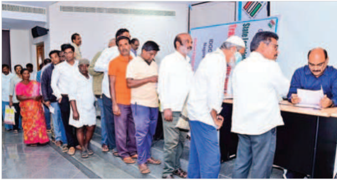
కలెక్టర్ టీవీ శ్రీనివాసులు ఎన్టీ కార్యాలయానికి పది ఫిర్యాదులు అందాయని తెలిపారు.

తెలిపారు. మొత్తం 92 ఫిర్యాదులు వచ్చినట్లు తెలిపారు. అందులో 65 ఫిర్యాదులు ధరణికి సంబంధించినవి కాగా, 27 ఫిర్యాదులు బీసీ వెల్ఫేర్, డిఆర్ డివో, పంచాయతీరాజ్, రెవెన్యూ తదితర శాఖలకు సంబంధించిన ఫిర్యాదులు వచ్చాయని తెలిపారు. కలెక్టర్ టీవీ శ్రీనివాసులు, ఈడిఎం సరేష్, ధరణి ఆపరేటర్లు, జిల్లా అధికారులు పాల్గొన్నారు. ఎన్టీ కార్యాలయానికి పది ఫిర్యాదులు నాగర్ కర్నూల్ ఎన్టీ కార్యాలయానికి సోమవారం నిర్వహించిన ప్రజావాణి ద్వారా ప్రజల నుంచి 10 ఫిర్యాదులు అందాయి. జిల్లాలోని పలుప్రాంతాల నుంచి ప్రజలు తమ సమస్యలపై అదనపు ఎన్టీ రామేశ్వర్ స్వయంగా కలిసి వివరించారు. ఈమేరకు వారి సమస్యలపై సంబంధిత ప్రాంతాల పోలీస్ అధికారులతో మాట్లాడి పరిష్కరించేందుకు