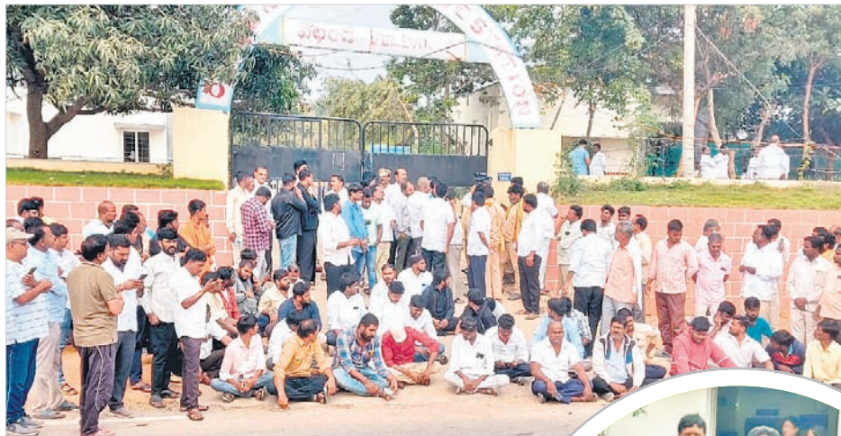
వెల్లండ పోలీస్ స్టేషన్ ఎదుట బైరాయిందిన బీఆర్ఎస్ శ్రేణులు

- నాగర్ కర్నూల్ / దేవరకల్ / జడ్చర్ల టౌన్, డిసెంబర్ 18