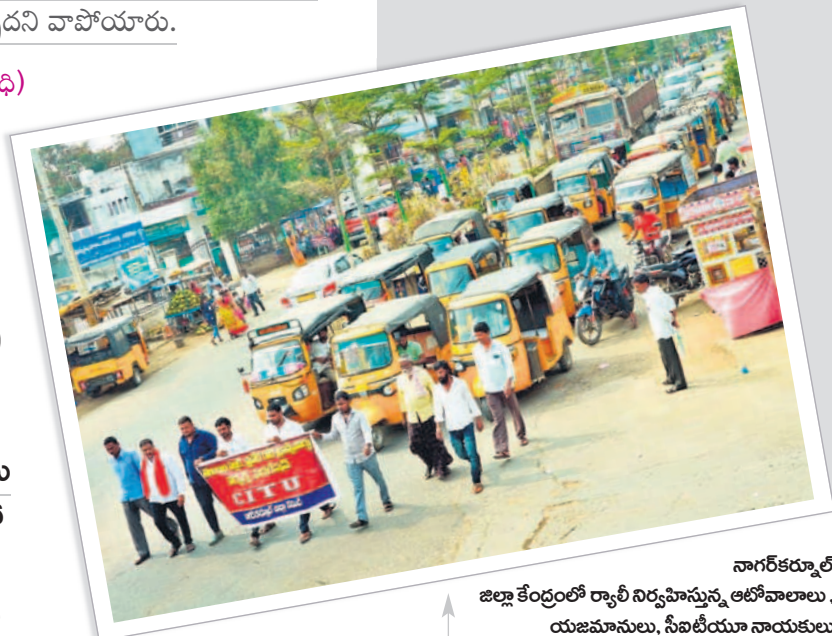
నాగర్ కర్నూల్ జిల్లా కేంద్రంలో ర్యాలీ నిర్వహిస్తున్న ఆటోవాలాలు. యజమానులు, సీబీయూ నాయకులు