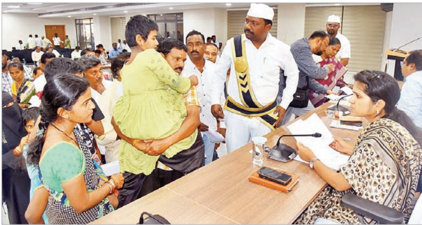
ప్రజావాణిలో ఫిర్యాదులు స్వీకరిస్తున్న కలెక్టర్ క్రాంతి

గద్వాల అర్బన్, డిసెంబర్ 18 : జిల్లా కేంద్రంలోని ఇండోర్ స్టేడియంలో మంగళ వారం అంతర్జాతీయ దివ్యాంగుల దినోత్సవం నిర్వహించనున్నట్లు జిల్లా సంక్షేమాధికారి ముషాహిదా బేగం సోమవారం ప్రకటనలో పేర్కొన్నారు.