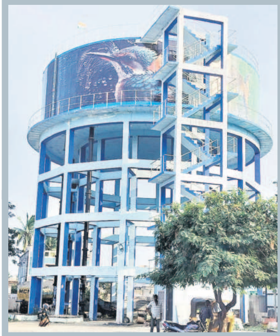
గాంధీ పార్కులో మిషన్ భగీరథ తాగునీరు అందించే ఓవర్ హెడ్ ట్యాంకు

రూ.57.71 కోట్లు మంజూరు రైల్వే బ్రిడ్జి నిర్మించాలని పట్టణ ప్రజలు ఏళ్లుగా కోరుతున్నారు. మాజీ ఎమ్మెల్యే జోగు రామన్న వంతెన నిర్మాణానికి ప్రత్యేక శ్రద్ధ వహించారు. ప్రయోజనాలను వివరిస్తూ గత ప్రభుత్వానికి సూచనలు