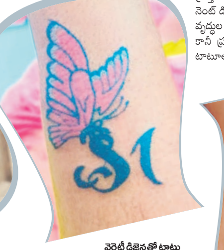
వెరైటీ డిజైన్లతో టాటూ