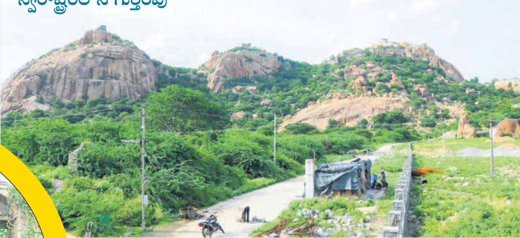
దేవరకొండ ఖిల్లాపై ఆలయం గుట్ట

700 ఏండ్ల చరిత్ర కలిగిన గిరి దుర్గానికి స్వరాష్ట్రంలోనే గుర్తింపు పర్యాటక కేంద్రంగా మార్చేందుకు కృషి రూ.6కోట్లతో పార్కులు, నీసీ రోడ్ల నిర్మాణం