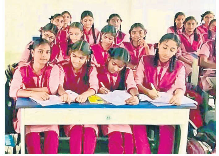
దామరచర్ల బీసీ గురుకులంలో చదువుకుంటున్న విద్యార్థిణులు

విద్యాలయంగా రూరల్ : డిసెంబర్ 18 : స్వరాష్ట్రంలో కేజీ టు పీజీ వరకు ఉచిత నాణ్యమైన విద్య అందించాలని ముఖ్యమంత్రి కేసీఆర్ గురుకుల పాఠశాలలను ఏర్పాటు చేశారు. ఉమ్మడి రాష్ట్రంలో బీసీ గురుకుల పాఠశాలలు రెండు మాత్రమే ఉండగా.. తెలంగాణ రాష్ట్రం ఏర్పడిన తరువాత 2017లో సీఎం కేసీఆర్ నియోజకవర్గానికి ఒకటి చొప్పున రాష్ట్ర వ్యాప్తంగా ఒకేరోజు 119 బీసీ గురుకులాలను ఏర్పాటు చేసి పేద విద్యార్థులకు నాణ్యమైన విద్య చేరువ చేశారు. ఒక్కో స్కూల్లో 480 మంది విద్యార్థులకు అడ్మిషన్లు కల్పించారు. వాటిని ఇంటర్మీడియట్ అండ్ గ్రేడ్ చేయడంతో బాలికల చదువు డ్రాఫ్టులే లేకుండా సాగుతున్నాయి.