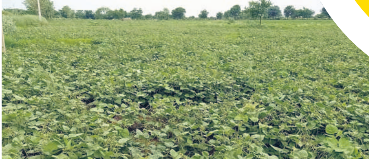
దామరచర్లలో ఆయకట్టు భూమిలో సాగు చేసిన పెనర

దామరచర్ల, డిసెంబర్ 18 : నాగార్జున సాగర్ ప్రాజెక్టులో నీళ్లు లేకపోవడంతో ఎడమ కాల్వ ఆయకట్టు పరిధిలో వరి సాగు ప్రశ్నార్థకమైంది. బోర్లు వేసుకున్న రైతులు మాత్రమే ఎకరం నుంచి రెండేకరాల వరకు సాగు చేస్తున్నారు. చాలా మంది రైతులు ఆరుతడి పంటలు వేశారు. వజీరాబాద్ మేజర్ కింద దామరచర్ల మండలంలోని కొండ్రపోల్, బండవల్ తండా, బాలాజీనగర్, దిలావర్పూర్, కేశ రావురం, కేశేఆర్ కావలి, రాళ్లవారు తండా, బొత్తపాలెం పాత గ్రామ పంచాయతీ పరిధిలోని తండాలు, గ్రామాల్లో వరి సాగు పూర్తిగా తగ్గిపోయింది. బోర్లు ఉన్న రైతులు మాత్రమే కొద్దిపాటి భూమిలో వరి సాగు చేస్తున్నారు. మిగతా రైతులు భూమిని ఖాళీగా ఉంచకుండా వచ్చజొన్న, మినము, పెనర పంటలు సాగు చేస్తున్నారు. మండలంలో సుమారు 200 ఎకరాల్లో ఆరుతడి పంటలను సాగు చేస్తున్నట్లు అంచనా. మండలంలో గత ఏడాది సుమారు పది వేల ఎకరాల్లో వరి సాగు చేయగా.. ఇప్పుడు సగానికి పడిపోయింది.