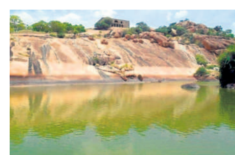
ఖిలాపై ఉన్న కోనేరు

హైదరాబాద్ - నాగార్జునసాగర్ ప్రధాన రహదారికి 7 కిలోమీటర్ల దూరంలో ఉన్న దేవరకొండ ఖిలాకు 700 ఏండ్ల చరిత్ర ఉన్నట్లు పురాతన కట్టడాలను పట్టి తెలుస్తున్నది. దేవరకొండ చుట్టూ సుమారు 524 ఎకరాల్లో కొండలు, గుట్టలు, మైదానం ప్రాంతాల్లో ఈ దుర్గం విస్తరించి ఉన్నట్లు పురావస్తు శాఖ అధికారులు తెలుపుతున్నారు. ఏడు కొండలను కలుపుతూ దుర్గంగా ఏర్పడిన దేవరకొండ ఖిలాను వెలమ రాజులు పరిపాలించినట్లు చరిత్ర తెలుపుతుంది. క్రీ.శ. 1361 సంవత్సరంలో ఆనపోత యాదా నాయకులు రాచకొండ, దేవరకొండ దుర్గాలు నిర్మించి ప్రభువులు అయ్యారు. క్రీ.శ. 1361 నుంచి 1384 వరకు యాదానాయకుడు దేవరకొండ ఖిలా అధిపతిగా కొనసాగారు. 1384 నుంచి 1399 వరకు దేవరకొండ కోటను రెండో ఆనపోత నాయకుడు పరిపాలించారు. 1421 నుంచి 1430 వరకు ఆనపోతనేని రెండో సోదరుడు పరిపాలించాడు. 1430