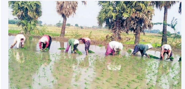
దామరచర్ల చెరువు కింద నాట్లు పెడుతున్న కూలీలు

బోర్ల కింద పంటల సాగుతో కళకళ భూములు వెలవెలబోతున్నాయి. మండలంలోని బోర్ల కింద సాగు చేస్తున్న రైతులకు చెరువులు కొంత ఊరటనిస్తున్నాయి. కేసీఆర్ ప్రభుత్వం చేపట్టిన మిషన్ కాకతీయ ఫలితంగా చెరువుల్లో నీళ్లు ఉండటం, భూగర్భ జలాలు పెరిగి బోర్లు పోస్తుండడంతో సమీప రైతులు వరి పంటను సాగు చేస్తున్నారు. చాలా బోర్లు ఇప్పటికే నాట్లు సైతం వేశారు. అయితే.. కాలం కలిసి వచ్చి వానలు పడితే చెరువులు పూర్తిగా నిండితే యాసంగి పంటలకు డ్రోకా ఉండనిన, లేదంటే కొంత ఇబ్బంది అవుతుంది దని రైతులు అభిప్రాయపడుతున్నారు.