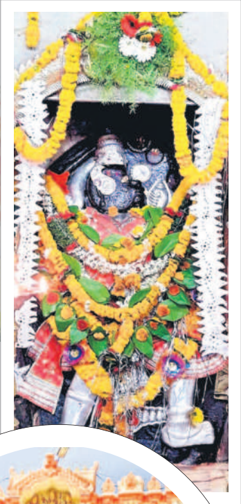
గర్భ గుడిలో మూలవిలాట్