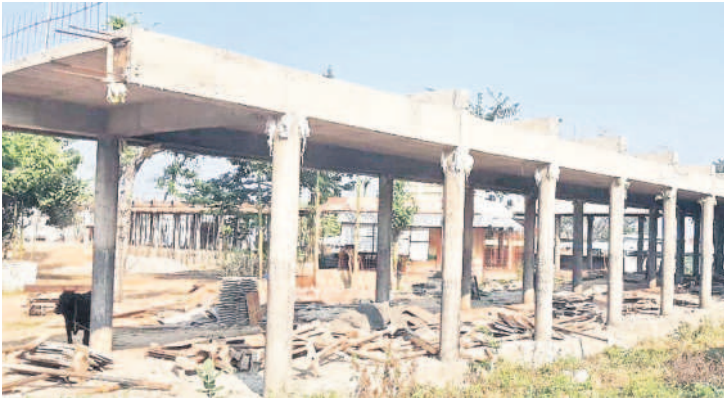
కొనసాగుతున్న ప్రాకార మండప నిర్మాణ పనులు