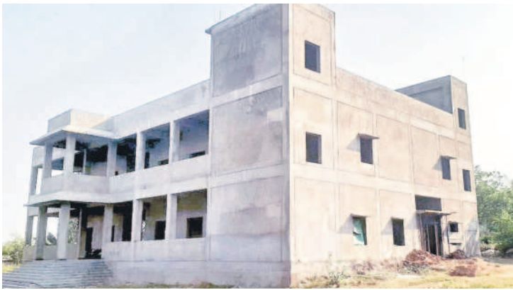
కొనసాగుతున్న కల్యాణ మండపం నిర్మాణం