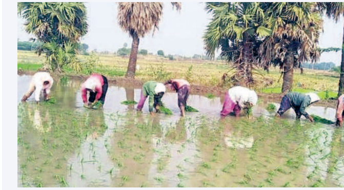
దామరచర్ల చెరువు కింద నాట్లు పెడుతున్న కూలీలు

బోర్ల కింద పంటల సాగుతో కళకళలాడుతుండగా.. కాల్వ కింద భూములు వెలవెలబోతున్నాయి. మండలంలోని బోర్ల కింద సాగు చేస్తున్న రైతులకు చెరువులు కొంత ఊరటనిస్తున్నాయి. కేసీఆర్ ప్రభుత్వం చేపట్టిన మిషన్ కాకతీయ ఫలితంగా చెరువుల్లో నీళ్లు ఉండటం, భూగర్భ జలాలు పెరిగి బోర్లు పోస్తుండడంతో సమీప రైతులు వరి పంటను సాగు చేస్తున్నారు. చాలా బోర్లు ఇప్పటికే నాట్లు సైతం వేశారు. అయితే.. కాలం కలిసి వచ్చి వానలు పడితే చెరువులు పూర్తిగా నిండితే యానంగి పంటలకు డ్రోకా ఉండనిన, లేదంటే కొంత ఇబ్బంది అవుతుంది దని రైతులు అభిప్రాయపడుతున్నారు.