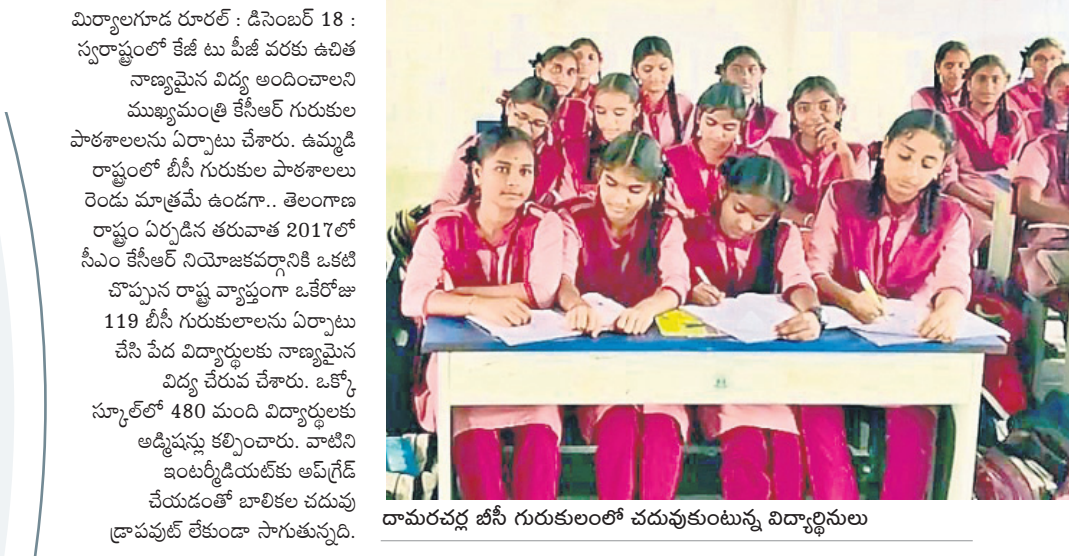
దామరచర్ల బీసీ గురుకులంలో చదువుకుంటున్న విద్యార్థిణులు

ఉమ్మడి జిల్లాలో 29 బీసీ గురుకుల పాఠశాలలు విద్యనభ్యసిస్తున్న 16,800 మంది విద్యార్థులు