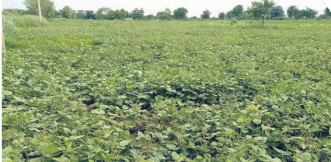
దామరచర్లలో ఆయకట్టు భూమిలో సాగు చేసిన పెసర

దామరచర్ల, డిసెంబర్ 18 : నాగార్జున సాగర్ ప్రాజెక్టులో నీళ్లు లేకపోవడంతో ఎడమ కాల్వ ఆయకట్టు పరిధిలో వరి సాగు ప్రశ్నార్థకమైంది. బోర్లు వేసుకున్న రైతులు మాత్రమే ఎకరం నుంచి రెండేకరాల వరకు సాగు చేస్తున్నారు. చాలా మంది రైతులు ఆరుతడి పంటలు వేశారు. వజీరాబాద్ మేజర్ కింద దామరచర్ల మండలంలోని కొండ్రపోత్, బండవల్ తండా, బాలాజీనగర్, దిలావర్పూర్, కేశ రావురం, కేశేఆర్ కాల్స్, రాళ్లవారు తండా, బొత్తపాలెం పాత గ్రామ పంచాయతీ పరిధిలోని తండాలు, గ్రామాల్లో వరి సాగు పూర్తిగా తగ్గిపోయింది. బోర్లు ఉన్న రైతులు మాత్రమే కొద్దిపాటి భూమిలో వరి సాగు చేస్తున్నారు. మిగతా రైతులు భూమిని ఖాళీగా ఉంచుకుంటూ పచ్చజొన్న, మినుము, పెసర పంటలు సాగు చేస్తున్నారు. మండలంలో సుమారు 200 ఎకరాల్లో ఆరుతడి పంటలను సాగు చేస్తున్నట్లు అంచనా. మండలంలో గత ఏడాది సుమారు పది వేల ఎకరాల్లో వరి సాగు చేయగా.. ఇప్పుడు సగానికి పడిపోయింది.