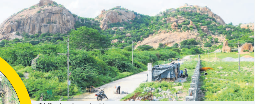
దేవరకొండ ఖిల్లాపై ఆలయం గుట్ట

700 ఏండ్ల చరిత్ర కలిగిన గిరి దుర్గానికి స్వరాష్ట్రంలోనే గుర్తింపు పర్యాటక కేంద్రంగా మార్చేందుకు కృషి రూ.6కోట్లతో పార్కులు, నీసీ రోడ్ల నిర్మాణం