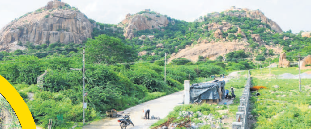
దేవరకొండ ఖిలాపై ఆలయం గుట్ట

పర్యాటక కేంద్రంగా మార్చేందుకు కృషి రూ.6కోట్లతో పార్కులు, సీసీ రోడ్ల నిర్మాణం