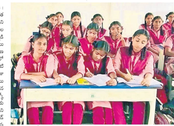
దామరచర్ల బీసీ గురుకులంలో చదువుకుంటున్న విద్యార్థినిలు

65 ఏండ్ల సమైక్య పాలనలో ఉమ్మడి నల్లగొండ జిల్లాలో బీసీలకు రెండు గురుకుల పాఠశాలలు (నాగార్జున సాగర్, మాసీ) మాత్రమే ఉండేవి. దాంతో పేద విద్యార్థులకు గురుకుల చదువు అందని ద్రాక్షగానే ఉండేది. తెలంగాణ రాష్ట్రం ఏర్పడిన తరువాత సీఎం కేసీఆర్ నియోజకవర్గానికి ఒకటి చొప్పున 12 బాలిక్ల పాఠశాలలు ఏర్పాటు చేశారు. ఆ తరువాత నల్లగొండ మూడు జిల్లాలుగా విభజన చేయడంతో జిల్లాకు ఒకటి చొప్పున మరో మూడు కొత్త గురుకుల స్కూళ్లను ప్రభుత్వం నెలకొల్పింది. దీంతో ఉమ్మడి నల్లగొండ జిల్లాలో రెండు గురుకుల పాఠశాలలు బాలయ 12.. మొత్తం 29 బీసీ గురుకుల పాఠశాలలు అందుబాటులోకి వచ్చాయి. వాటిల్లో