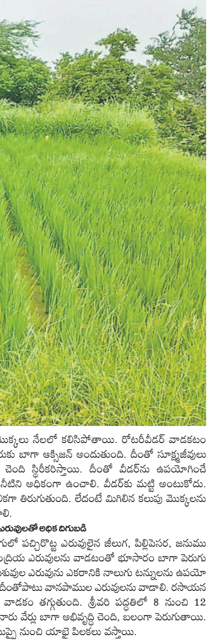
కలుపు మొక్కలు నేలలో కలిసిపోతాయి. రోటిపిడిరకం వాడకం వలన వేరుకు బాగా ఆక్సిజన్ అందుతుంది. దీంతో నూత్నజీవులు అభివృద్ధి చెంది స్థిరీకరిస్తాయి. దీంతో వీడెర్లు ఉపయోగించే ముందు నీటిని అధికంగా ఉంచాలి. వీడెర్లకు మట్టి అంటుకోదు. వీడెర్ తెలిక తిరుగుతుంది. లేదంటే మిగిలిన కలుపు మొక్కలను తీసేయాలి.