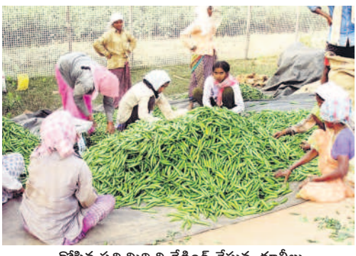
కోసిన పచ్చిమిర్చిని గ్రేడింగ్ చేస్తున్న కూలీలు