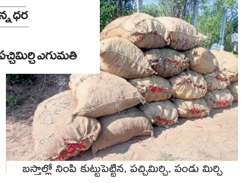
బస్తాల్లో నింపి కుట్టుపెట్టిన, పచ్చిమిర్చి, పండు మిర్చి