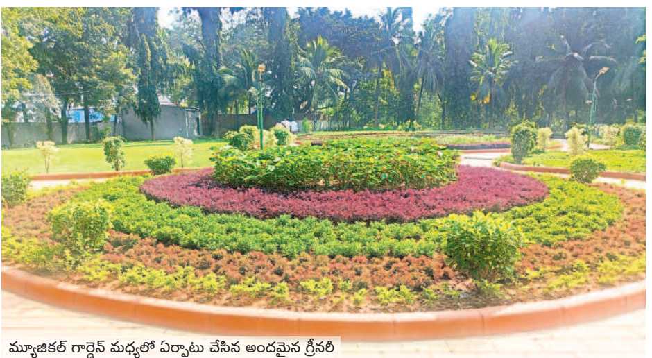
మ్యూజికల్ గార్డెన్ మధ్యలో ఏర్పాటు చేసిన అందమైన గ్రీనరీ

తుది దశకు అభివృద్ధి పనులు కాకతీయ మ్యూజికల్ గార్డెన్ అభివృద్ధి పనులు చివరి దశకు చేరుకున్నాయి. మ్యూజికల్ గార్డెన్ లో ముందుభాగంలో గ్రీనరీ పనులు దాదాపుగా పూర్తిచేశారు. బిన్యూరుల కోసం ఆట వస్తువులను ఏర్పాటుచేశారు. పుటేపాతలను టైల్స్ తో అందంగా తీర్చిదిద్దారు. మ్యూజికల్ గార్డెన్ లోని రెండు ట్రిడ్డెలను అందంగా ముస్తాయి చేశారు. గతంలో ట్రిడ్డెలకు పైకప్పు ఉండేది కాదు. పునరుద్ధరణలో బాగాగా ఇప్పుడు ట్రిడ్డెలకు పైకప్పులతో పాటు గ్రానైట్ టైల్స్ వేశారు. దీంతో ట్రిడ్డెలు అందంగా కనిపిస్తున్నాయి.