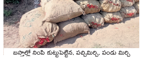
బస్తాల్లో నింపి కుట్టుపెట్టిన, పచ్చిమిర్చి, పండు మిర్చి