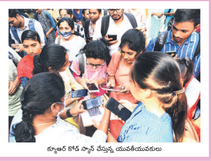
క్యాంపస్ కోడ్ స్కాన్ చేస్తున్న యువతీయువకులు

ప్రస్తుతం పచ్చి, పండు మిర్చికి మార్కెట్ లో మంచి డిమాండ్ ఉంది. తీతో ఇటు పంట సాగు చేసిన రైతులకు నిరులు కురిపిస్తుండగా, కూలీలకూ చేతనిండా పనిదొరుకుతోంది. ఒకప్పుడు పెట్టుబడికి ఇబ్బంది పడే పరిస్థితి ఉండగా ప్రస్తుతం ఆశించిన దిగుబడి వస్తుండడంతో ఇతర ప్రాంతాలకు సైతం ఎగుమతి అవుతోంది. క్వింటాల్ కు రూ.3వేల ధర వలు కుతుండడంతో మిర్చి రైతుల్లో సంతోషం కనిపిస్తోంది. - వాజేడు, డిసెంబర్ 18