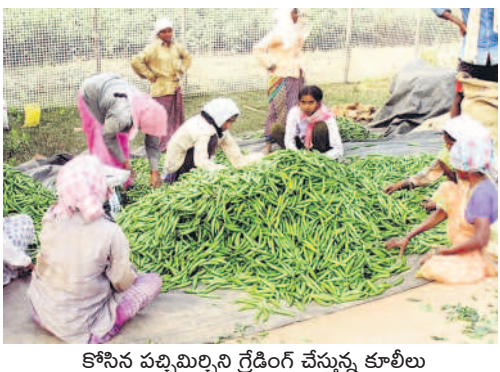
కోసిన పచ్చిమిర్చిని గ్రేడింగ్ చేస్తున్న కూలీలు