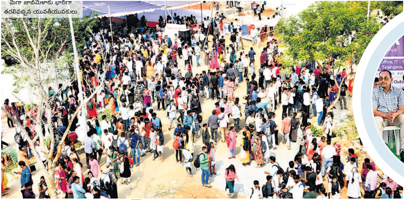
మెగా జాబ్ మేళాకు భారీగా తరలివచ్చిన యువతీయువకులు