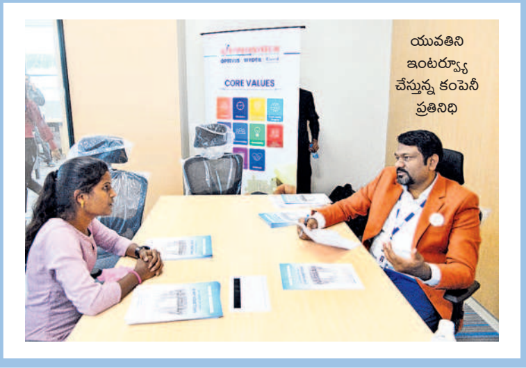
యువతని ఇంటర్వ్యూ చేస్తున్న కంపెనీ ప్రతినిధి