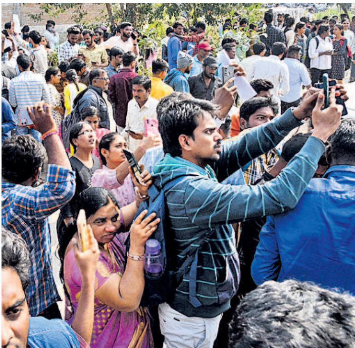
క్యాంపస్ కోడ్ను స్కాన్ చేస్తున్న ఉద్యోగార్థులు