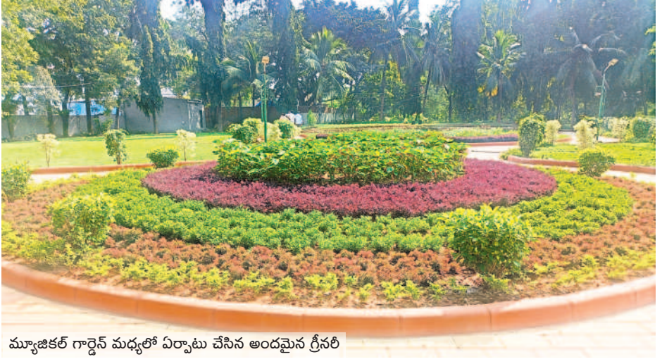
మ్యూజికల్ గార్డెన్ మధ్యలో ఏర్పాటు చేసిన అందమైన గ్రీనరీ

తుది దశకు అభివృద్ధి పనులు కాకతీయ మ్యూజికల్ గార్డెన్ అభివృద్ధి పనులు చివరి దశకు చేరుకున్నాయి. మ్యూజికల్ గార్డెన్ లో ముందుభాగంలో గ్రీనరీ పనులు దాదాపుగా పూర్తిచేశారు. బిన్యూరుల కోసం ఆట వస్తువులను ఏర్పాటుచేశారు. పుల్ హాత్ లను టైల్స్ తో అందంగా తీర్చిదిద్దారు. మ్యూజికల్ గార్డెన్ లోని రెండు బ్రిడ్జిలను అందంగా ముస్తావు చేశారు. గతంలో బ్రిడ్జిలకు పైకప్పు ఉండేది కాదు. పునరుద్ధరణలో బాగాగా ఇప్పుడు బ్రిడ్జిలకు పైకప్పులతో పాటు గ్రానైట్ టైల్స్ వేశారు. దీంతో బ్రిడ్జిలు అందంగా కనిపిస్తున్నాయి.